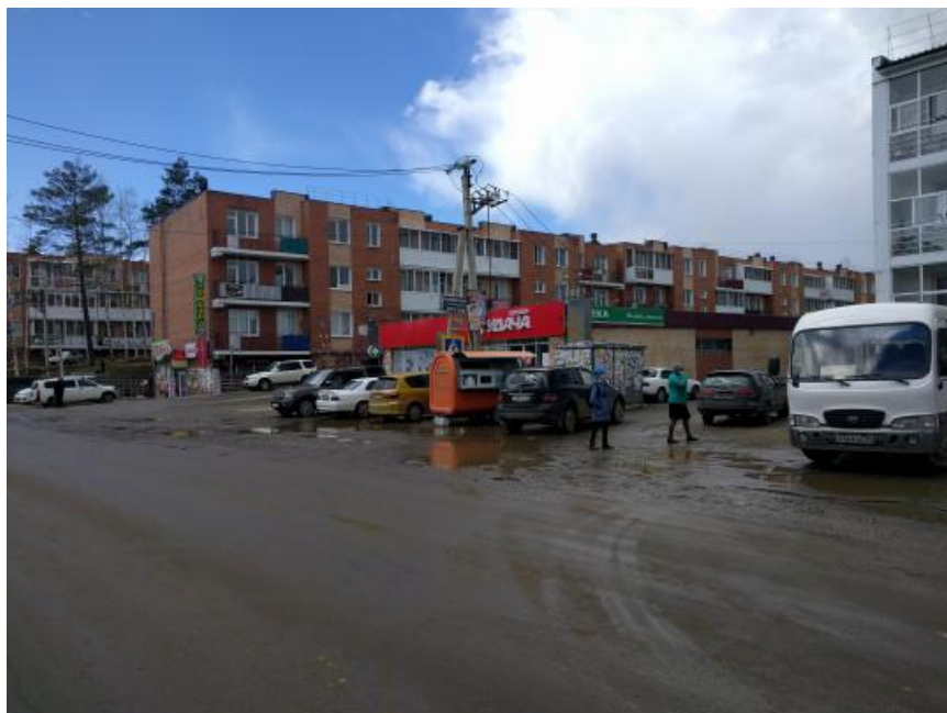
Конечная остановка автобусов и маршруток в "Березовом". Ямы, грязь, лужи.