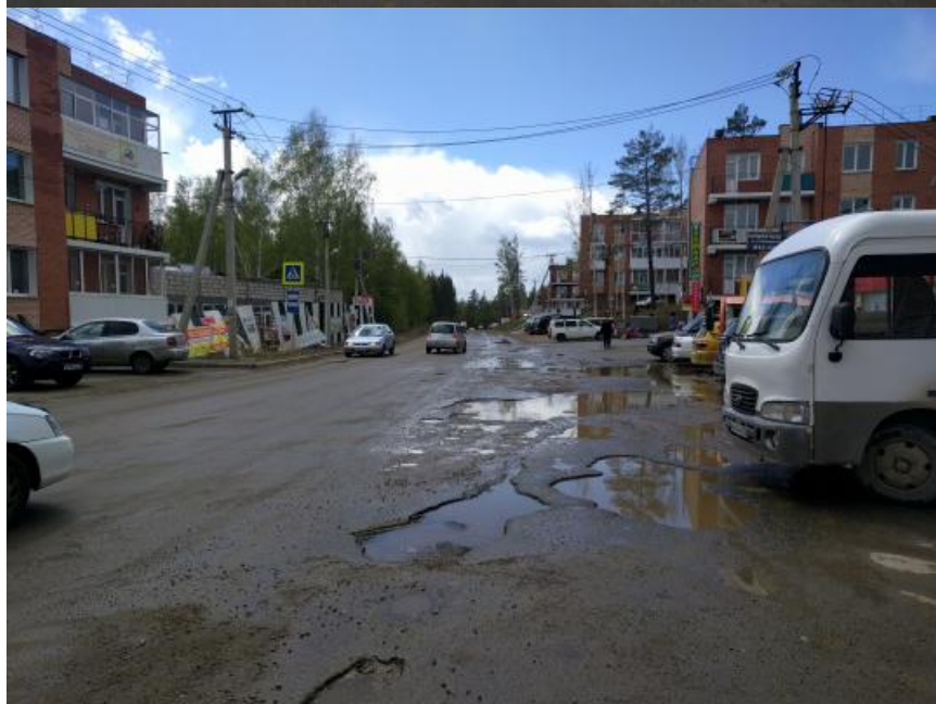
По итогам последней зимы дорога в "Березовом" пришла в полную негодность. Асфальт и бетон сошли вместо со снегом. Яма на яме.