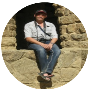
Автор текста: Андрей Шрамко , журналист.