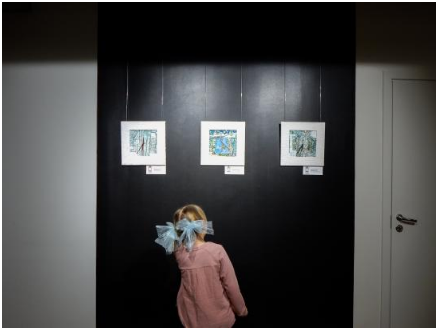
Три иркутских времени