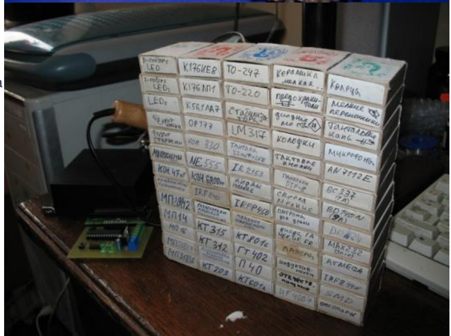
Фото: bookin.org.ru , alimero.ru , fishki.net

Автор: Филипп Марков © Babr24.com СОБЫТИЯ, МИР 10064 02.03.2017, 05:26 1097 URL: https://babr24.com/?ADE=156325 Bytes: 2847 / 2481 Версия для печати