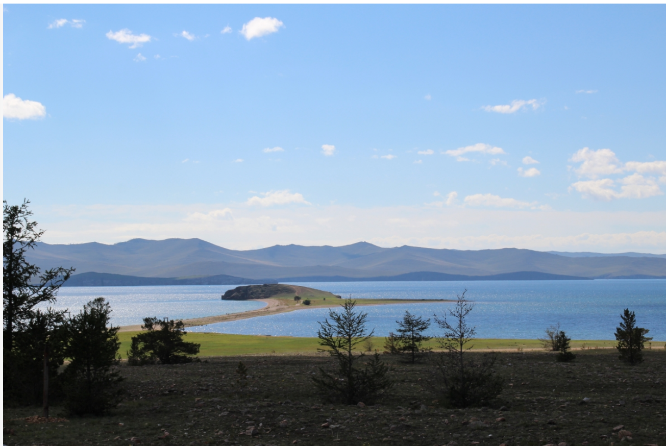
Фотограф: Дмитрий Таевский © Фотобанк Бабра

Автор: Галина Солонина © Babr24.com ТУРИЗМ, ЭКОЛОГИЯ, ЭКОНОМИКА И БИЗНЕС, БАЙКАЛ, ИРКУТСК 👁 17537 09.02.2017, 23:16