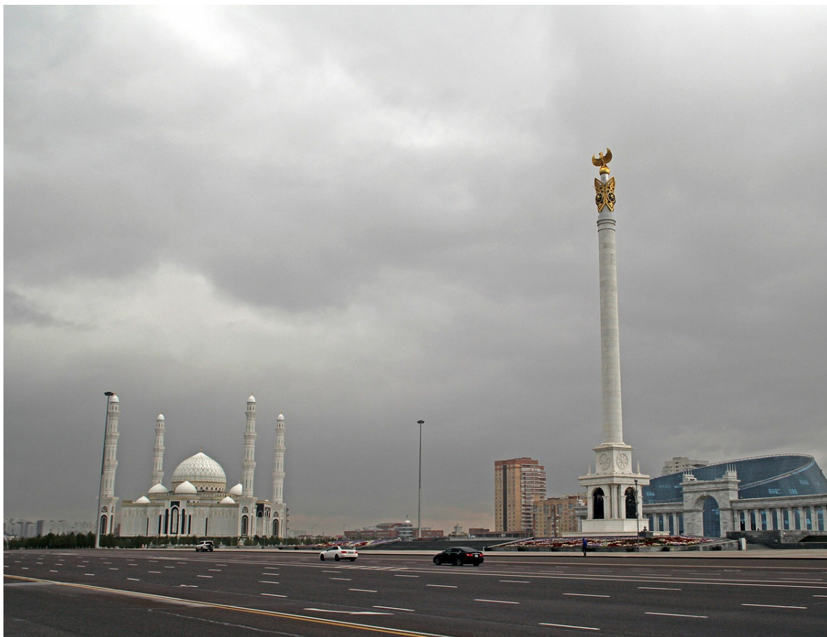
Площадь независимости. Просторная настолько, что не влезает в кадр даже с большого удаления.