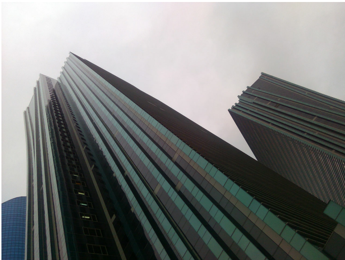
Как бы небоскребы.