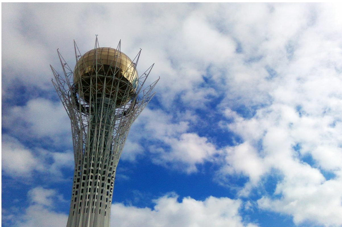
"Зерна и хлеба".

Автор: Андрей Темнов © Babr24.com ГЕО, ТУРИЗМ, МИР 👁 9924 06.02.2017, 17:14 📌 1740