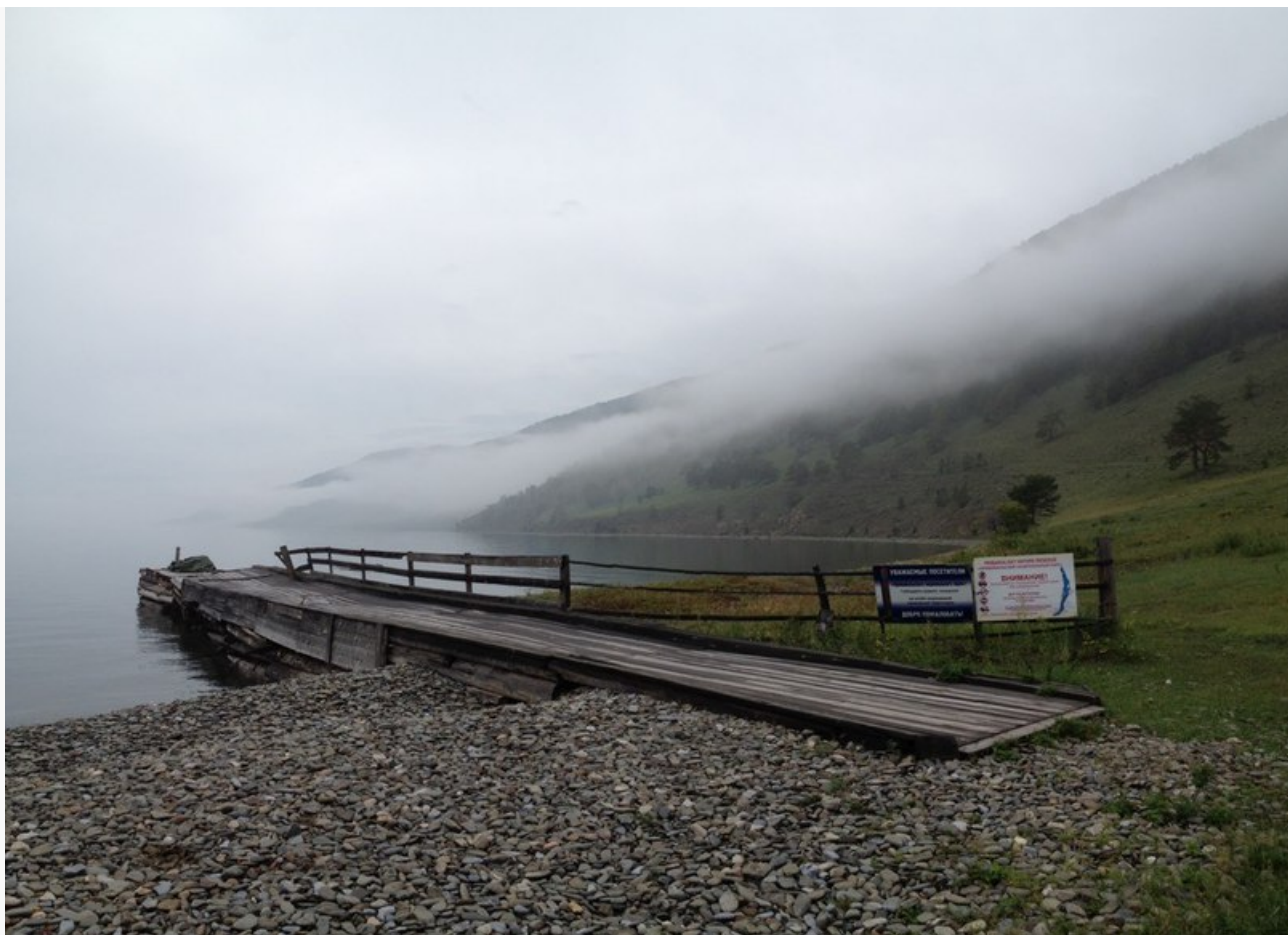
Фотограф: Инга Гаврикова © Фотобанк Бабра

Автор: iFox © Babr24.com ЭКОЛОГИЯ, БАЙКАЛ, ИРКУТСК 👁 11170 23.01.2017, 16:13 🏠 1344 URL: https://babr24.com/?ADE=154712 Bytes: 2127 / 1828 Версия для печати Скачать PDF