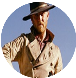
Автор текста: Андрей Светлов , политический обозреватель.

На сайте опубликовано 1844 текстов этого автора.