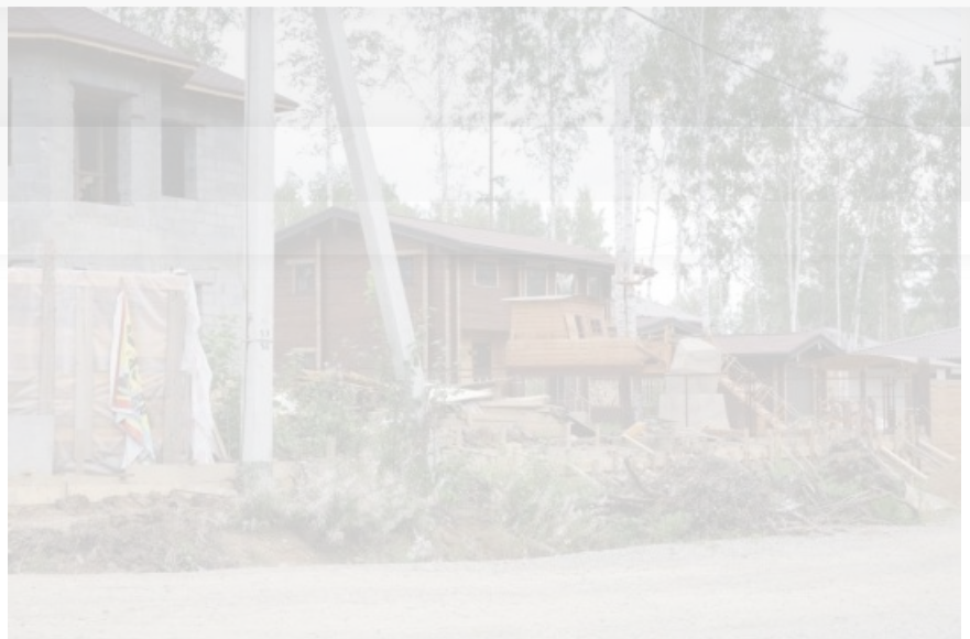
ТСН "Мечта" под Иркутском

Похожая проблема имеет место во многих МО района - в общей сложности угроза выселения и потери собственности нависла над несколькими тысячами граждан.