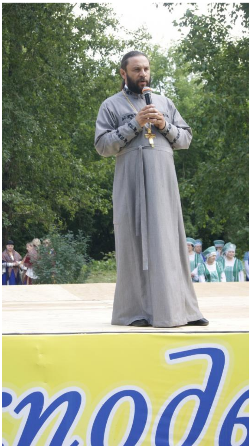
Гости из Знаменского собора города Иркутска.