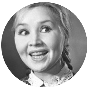
Автор текста: Фрося Бурлакова , журналист.

На сайте опубликовано 3223 текстов этого автора.