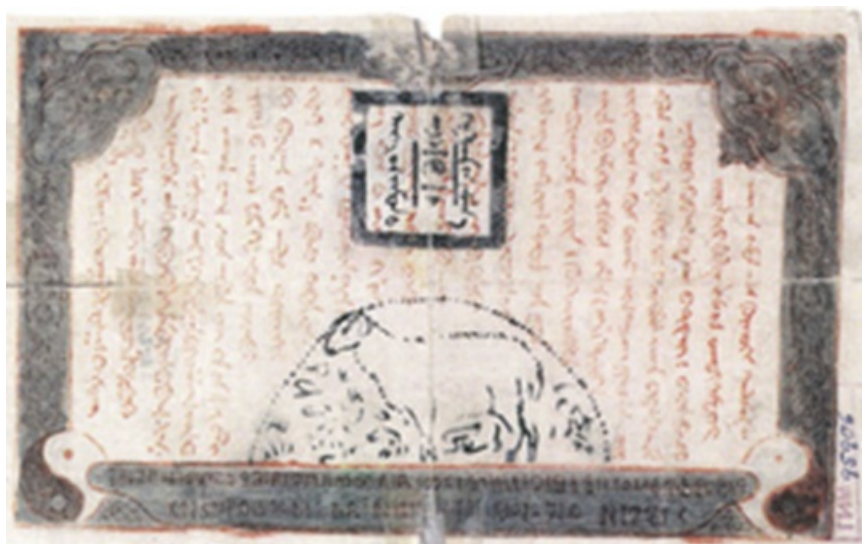
Банкнота в 10 долларов 1921 года

Однако в 1925 году Монголия добровольно перешла на социалистический путь развития. В стране была принята кириллическая письменность, введена новая денежная единица - тугрик. Новые банкноты монгольских долларов так и не были пущены в обращение, и являются большой редкостью.