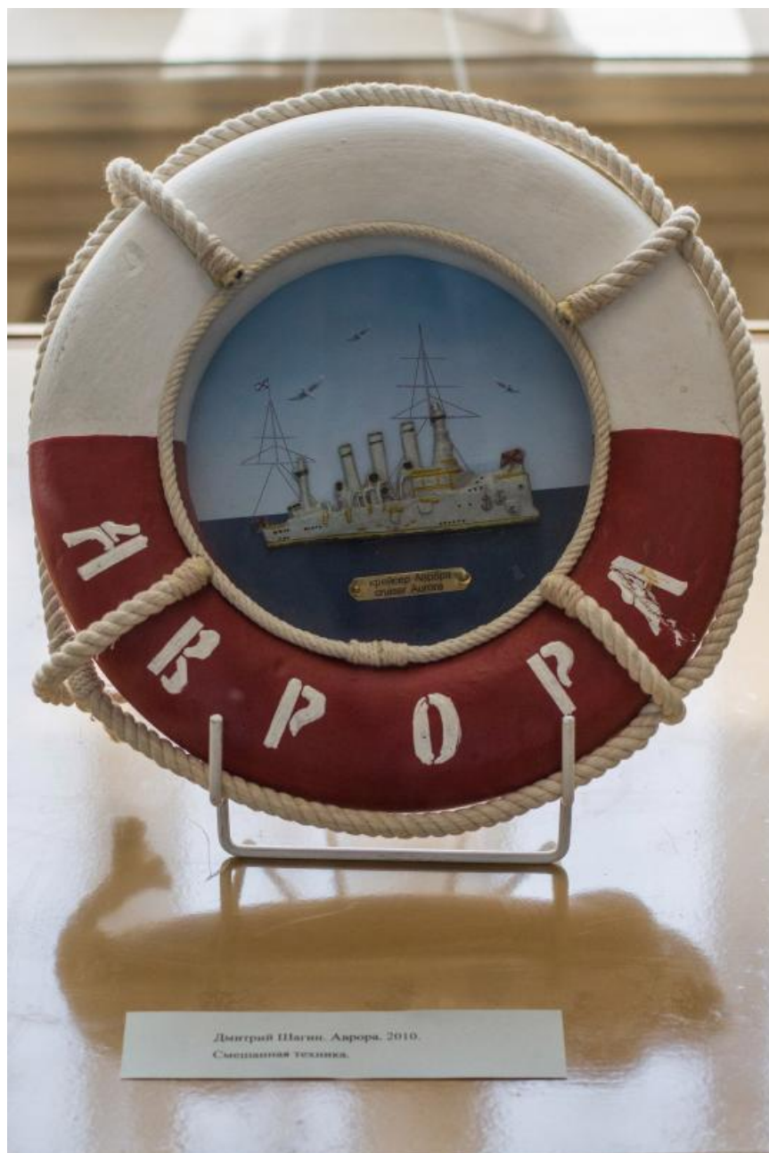
Дмитрий Шагин. Аврора. 2010. Смешанная техника.