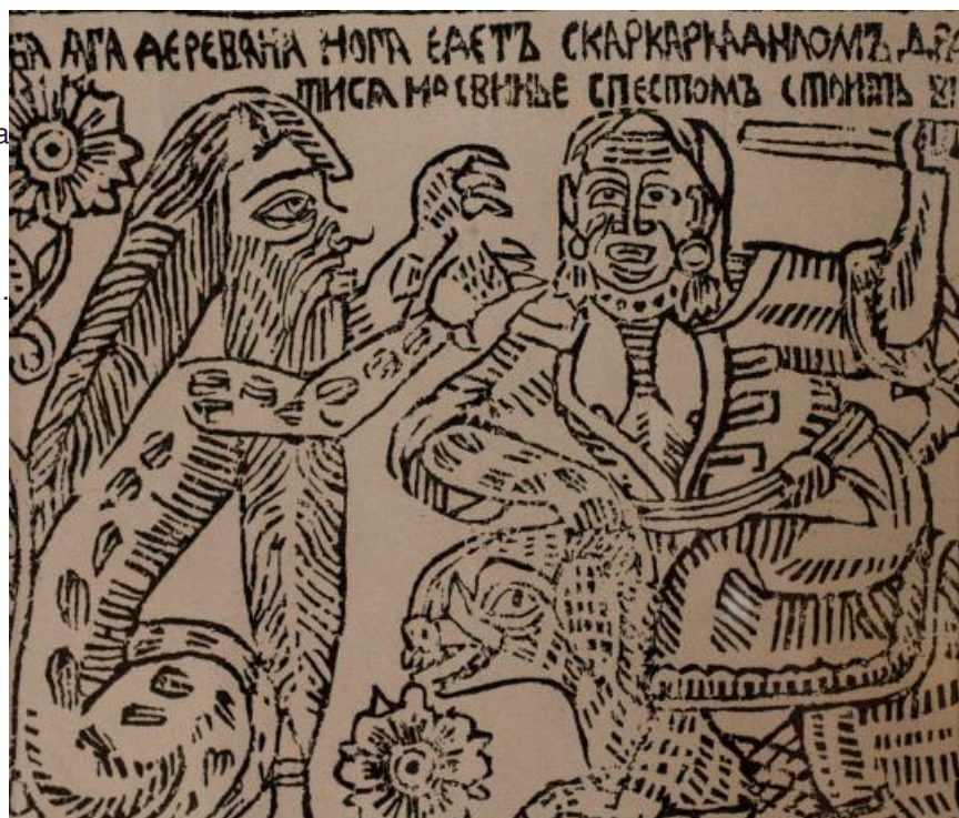
Работа А. Филиппова

Представленная на выставке графика «Митьков» продолжает лубочную тему. Например, на этих листах обрели новое художественное воплощение ленинградские частушки.