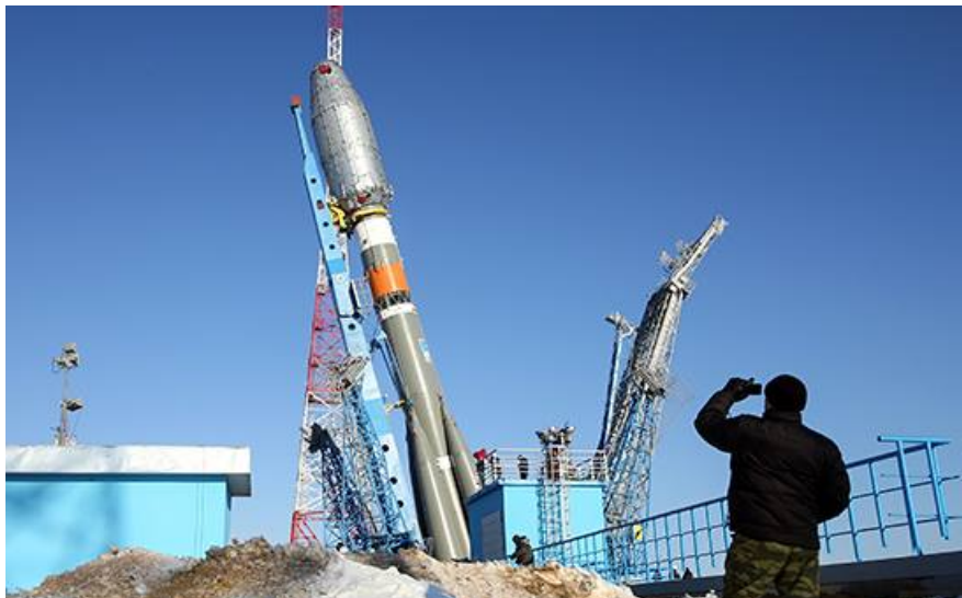
Фото установки ракеты на стартовый стол космодрома. Обтекатель серебристый (на самом деле это термокожух), вторая ступень серая, другие ступени тоже серые.

Устойчивой версии происходящего пока нет. Ясно только одно: доверчивым телезрителям показали добросовестно снятую постановку.