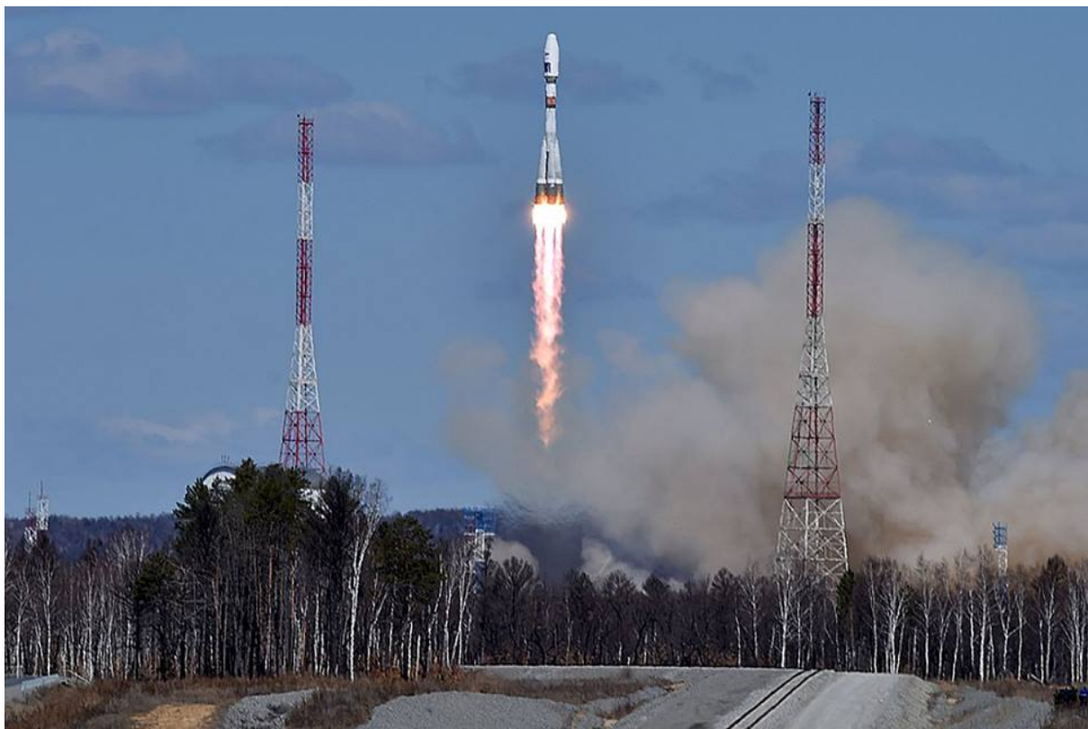
Видео старта ракеты с Первого канала. Первая и вторая ступень белая, на первой ступени характерные белые и серые полосы.