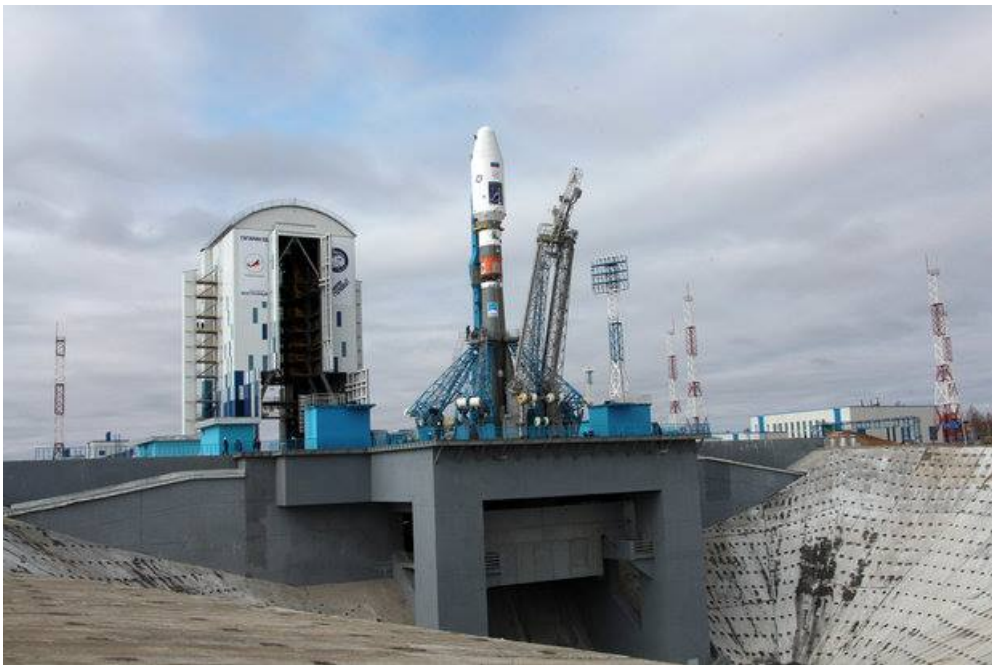
Ракета на старте. Обтекатель белый, вторая ступень серая, другие ступени тоже серые.