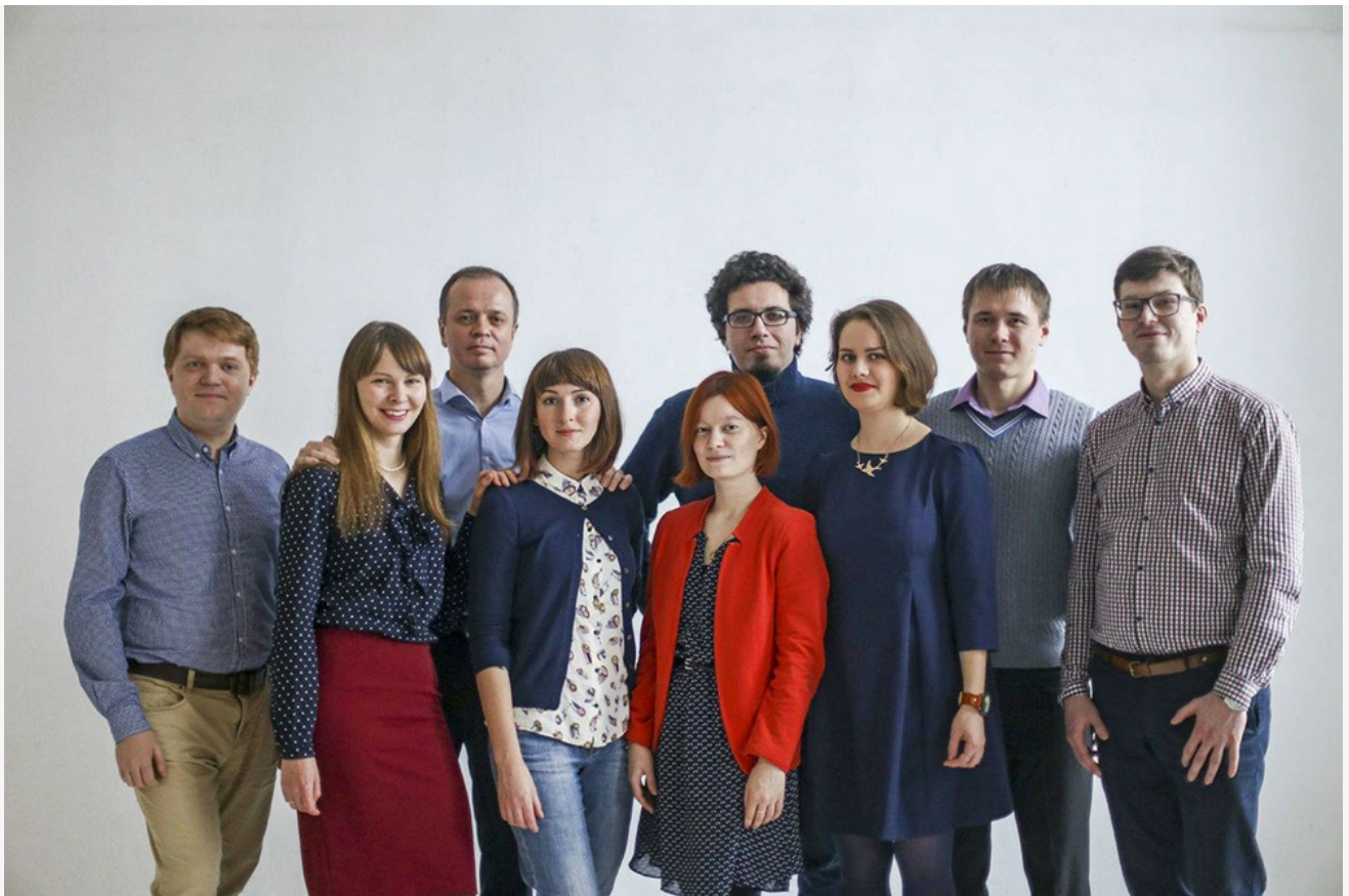
Юристы «Команды 29»