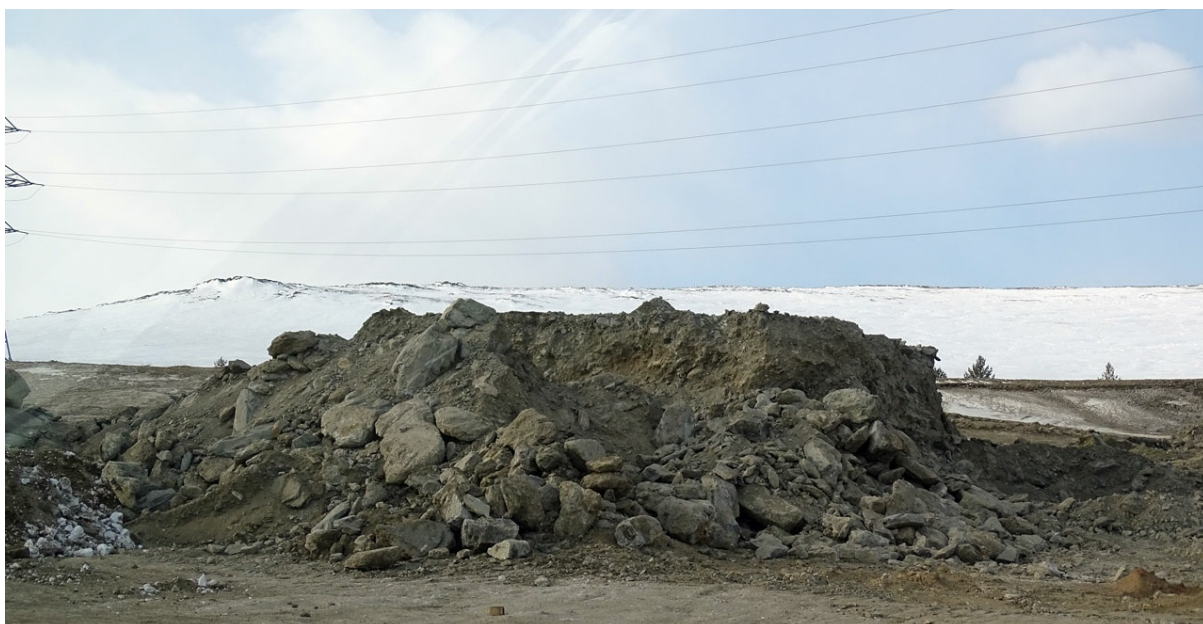
Свежие кучи камней и почвы явно местного происхождения.