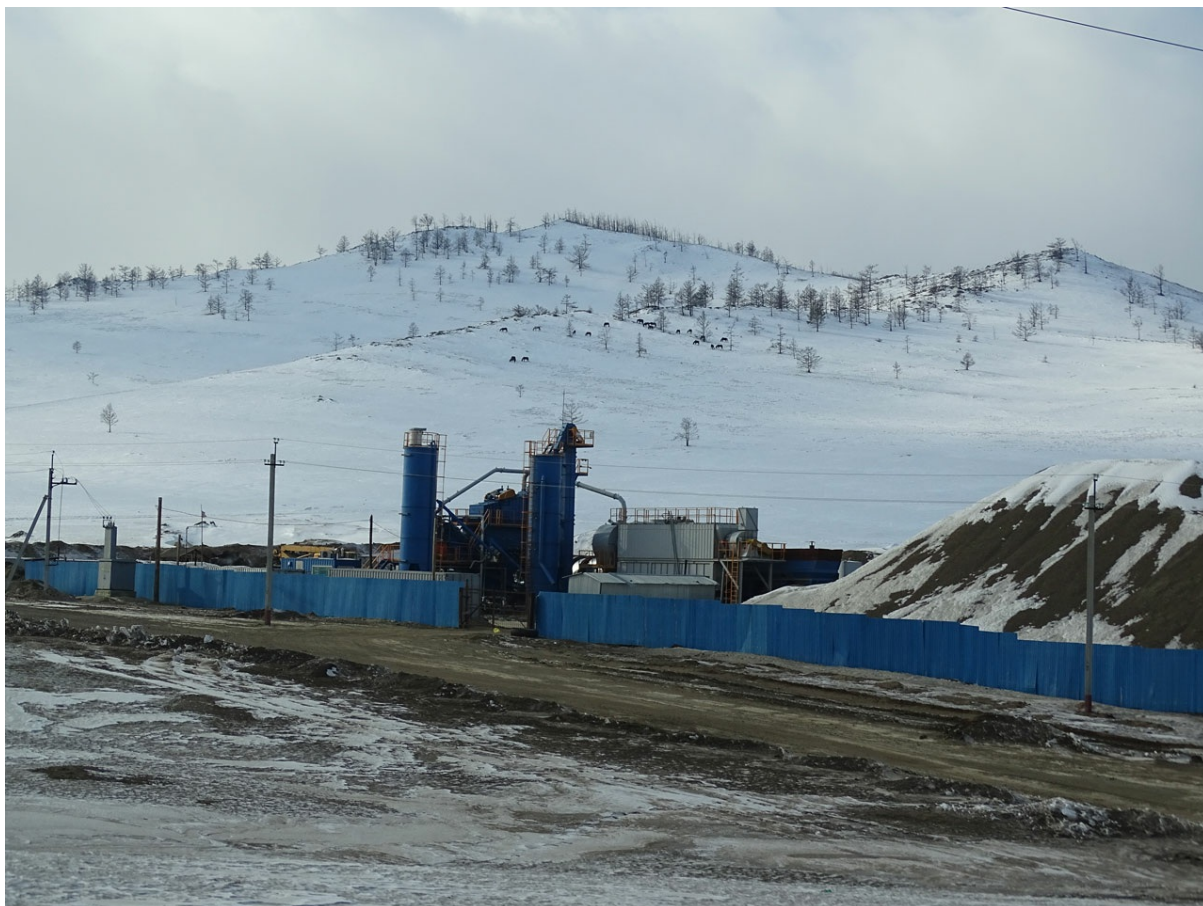
Основная база ООО "СПМК-7" в районе поворота на Черноруд хорошо известна всем иркутским автомобилистам.