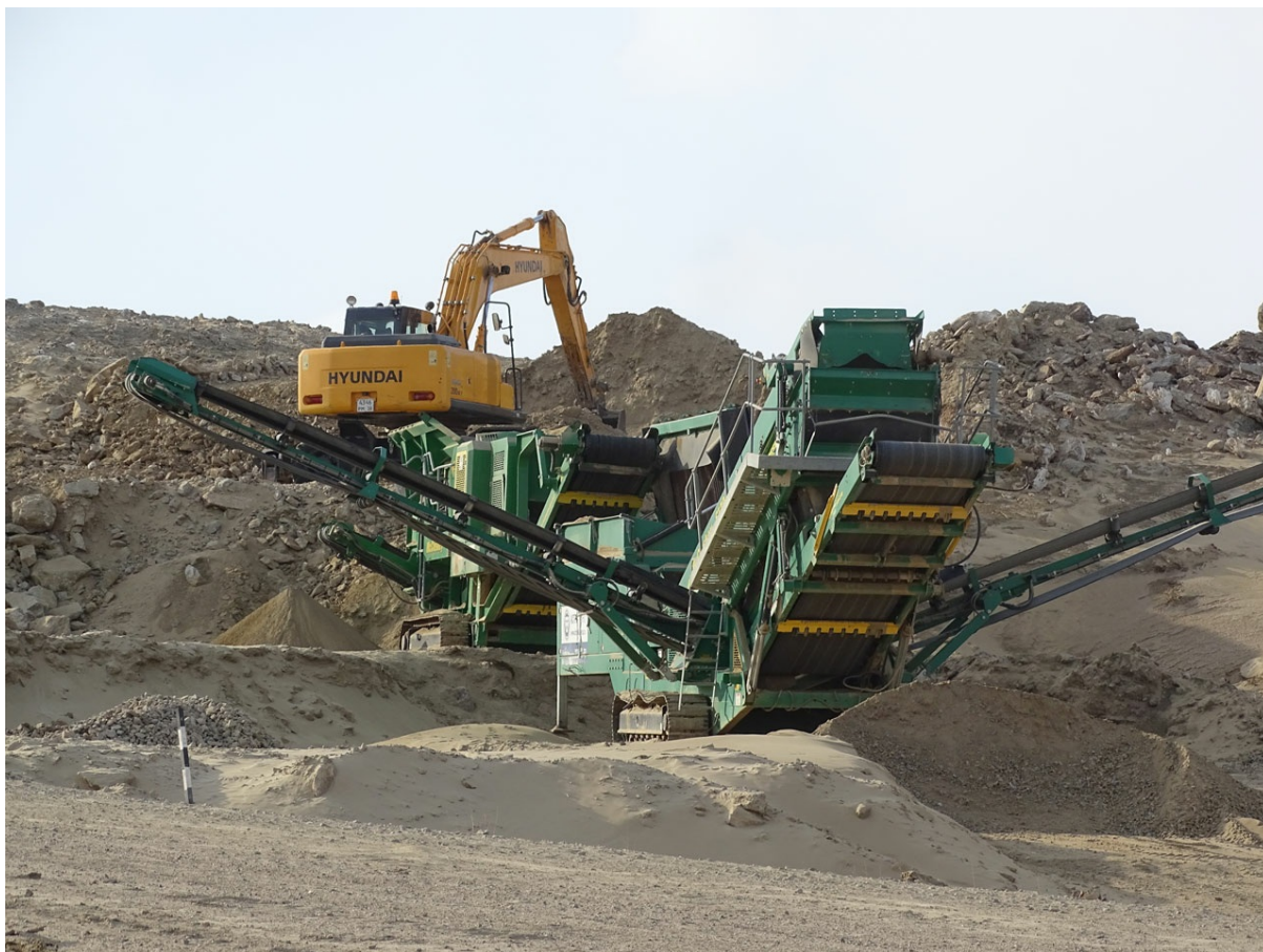
База по сортировке грунта, предназначенного для подготовки полотна дороги.