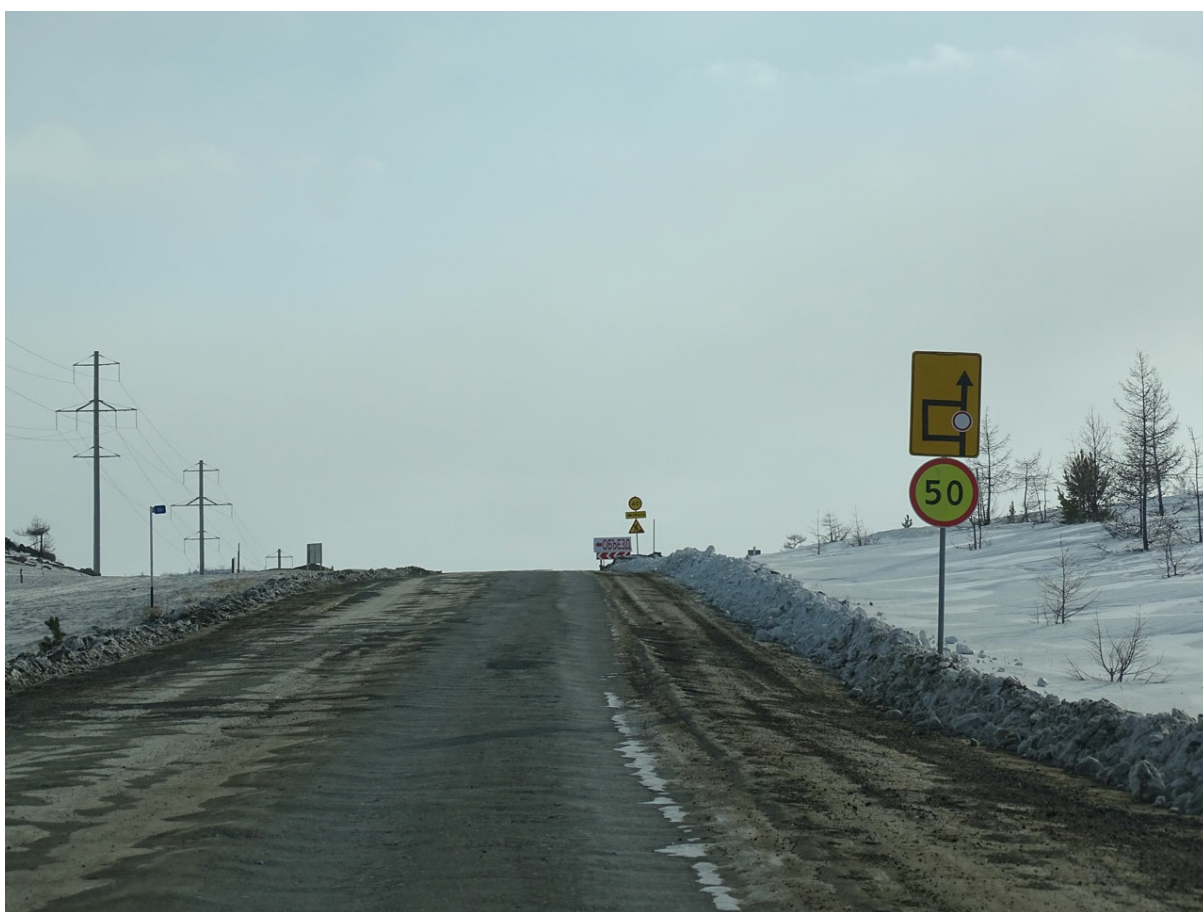
Покамест грунтовый разрыв в прежних границах: начинается от соленых озер в Тажеранской степи и заканчивается спуском к чернорудской развязке.