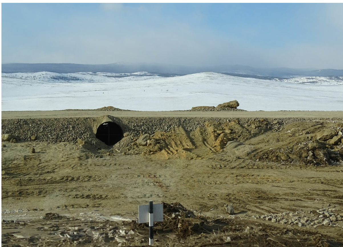
Финальная стадия земельных работ.