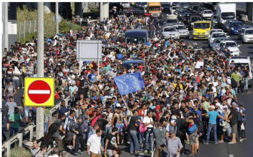
Фото: rusvesna.su , cznews.ru

Автор: Влад Красов © Babr24.com ОБЩЕСТВО, РОССИЯ