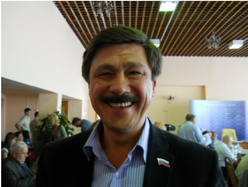
Фото: Андрей Лаховский

Автор: Максим Бакулев © Babr24.com Источник: onenoll.ru ПОЛИТИКА, ИРКУТСК, 02.01.2016, 18:37 1561 31220