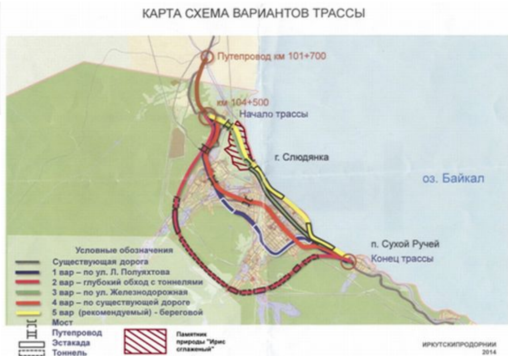
Рис. 2 Схема вариантов прохождения федеральной трассы вокруг г.Слюдянки

4. Несмотря на заданные вопросы, не была рассмотрена проблема нарушения рекреационной (пляжной и парковой) зоны города, относящейся к городским лесам, по которой будет проходить выбранный 5 (береговой) вариант трассы.