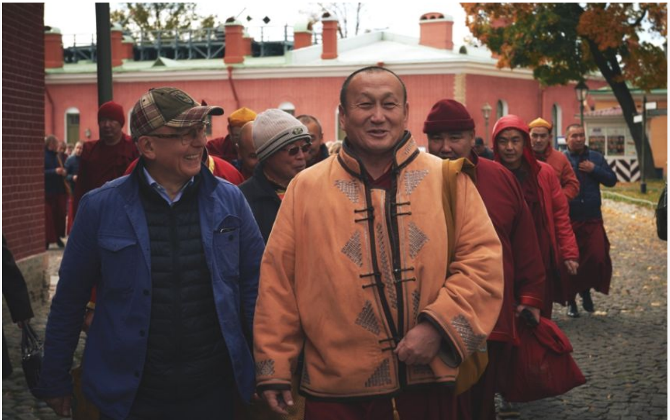
В Петербурге с ламами из Иволгинского дацана. Хамбо лама выстрелил из пушки на Петропавловской крепости