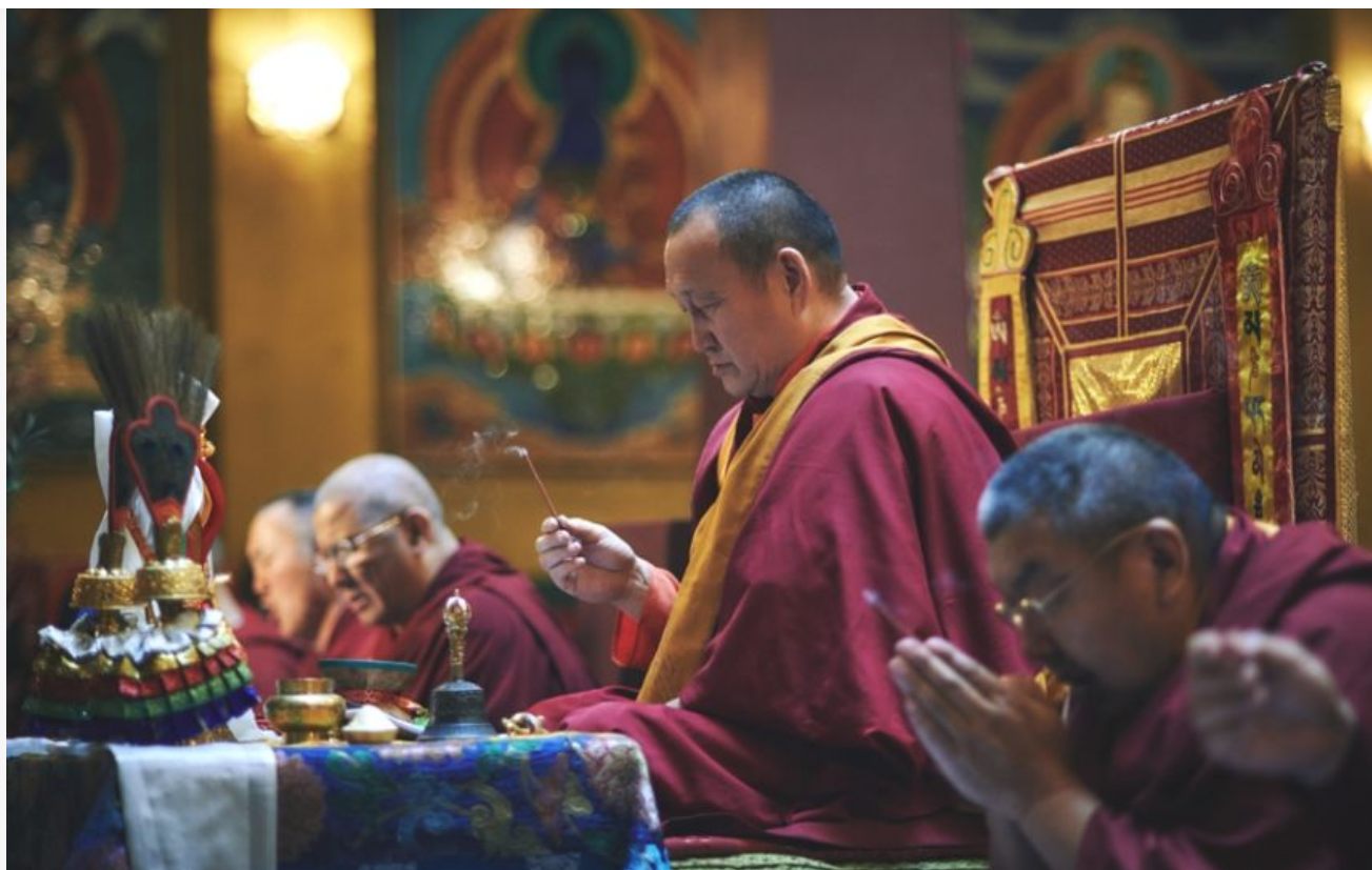
Хамбо лама Аюшеев на молебне в честь 100-летия Петербургского дацана

XXIV Пандито Хамбо лама Дамба Аюшеев живёт в Бурятии. Последние 20 лет он возглавляет Буддийскую традиционную Сангху (общину) России. О вере и ламах, о своих страхах и надеждах рассказывает Дамба Аюшеев.