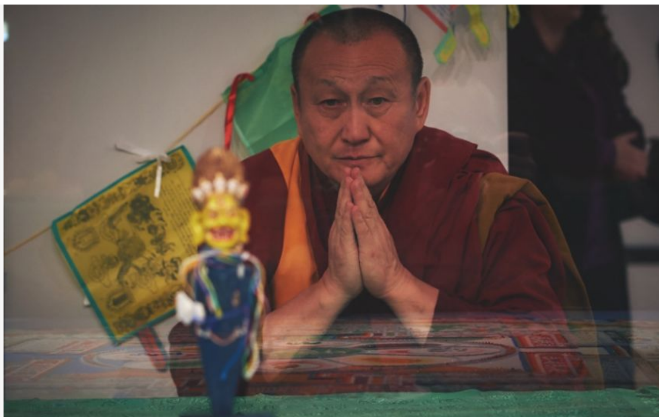
Главный буддист России

При всём моём уважении к женщинам они не в состоянии постичь буддийскую философию. В тантрическом смысле – пожалуйста: у нас есть женщины-божества. А вот в философском – нет. Пусть женщина мечтает в своём сыне найти ламу. В этом случае он всю жизнь будет молиться за свою мать.