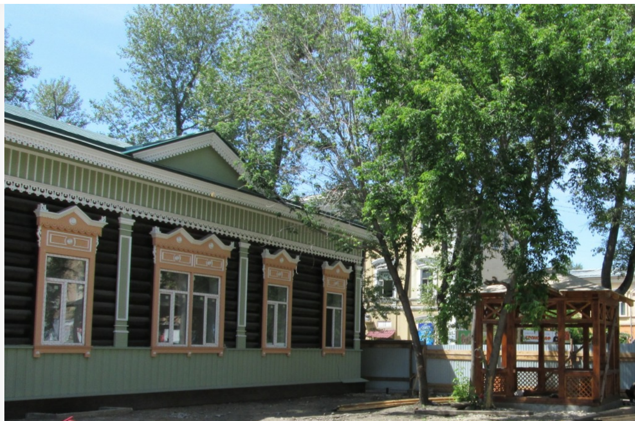
Дом по ул. Горького, 34

Нужно было добиться понимания собственниками того, что нужно строить объекты на участках согласованно – чтобы была синергия, только тогда возможно будет создать комфортное общественное пространство. Задача эта была решена. Реализация проекта в жизнь начнется, вероятно, в следующем году. Полноценный привлекательный квартал здесь появится примерно к 2020 году, конечно, если все пойдет по плану. Здесь задумано сделать удобную парковку, пешеходные зоны. Разработчики проекта предусматривают здесь разместить и национальные общественно-культурные центры, культурные объекты, кафе и ресторанчики. «Поток людей здесь будет, вероятно, даже больше, чем в 130 квартале, поэтому инвесторам должно быть весьма выгодно участвовать в реставрации домов-памятников на этой территории», – считает гендиректор АРПИ.