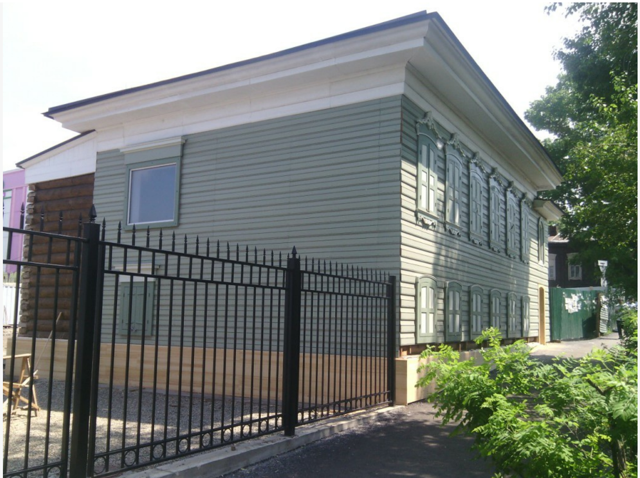
Дом по ул. Байкальская, 27

«Я считаю, что проект «1 рубль за 1 метр» очень правильная и своевременная инициатива. Сначала была апробация на уровне Москвы – несколько объектов культурного наследия, находящихся в аварийном состоянии, были выставлены на конкурс в аренду. Условиями конкурса предполагалось, что арендатор платит рыночную стоимость аренды во время проведения реставрационных работ, на это ему дается 7 лет, после завершения работ – 1 рубль за 1 метр в течении 49 лет за вычетом срока работ, – рассказывает гендиректор АРПИ. – Данный механизм заинтересовал инвесторов. После чего было решено распространить данную практику повсеместно. Были внесены изменения в федеральный закон № 73-ФЗ «Об объектах культурного наследия (памятников истории и культуры) народов Российской Федерации о том, что объекты, находящиеся в неудовлетворительном состоянии, могут быть предоставлены в льготную аренду до 49 лет при условии соблюдения требований, установленных законодательством».