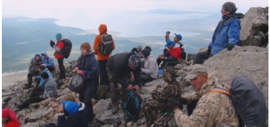
Мунку Сардык встретил нас сильным ветром дождём и снегом