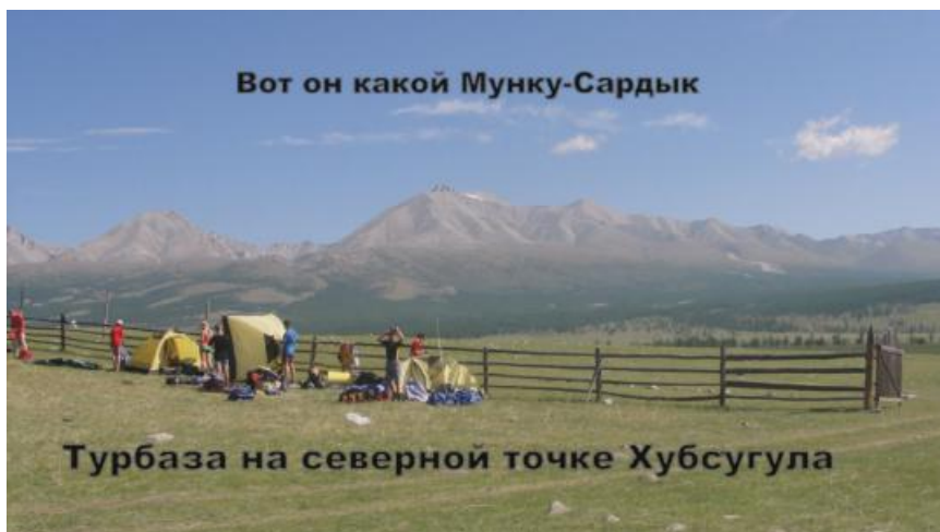
Турбаза на северной точке Хубсугула

- В акции, которая была приурочена к 70-летию Победы в Великой Отечественной войне и 76-летию событий на Халхин Голе, нам предлагалось водрузить над вершиной Мунку-Сардык копию Знамени Победы во Второй Мировой войне. Желающих было много, но в эту экспедицию попали самые достойные. Вместе с нашими коллегами из Иркутска, Ангарска и других городов области покорять вершину отправились девять усольчан. Всего от Иркутской области участвовали около шестидесяти человек.