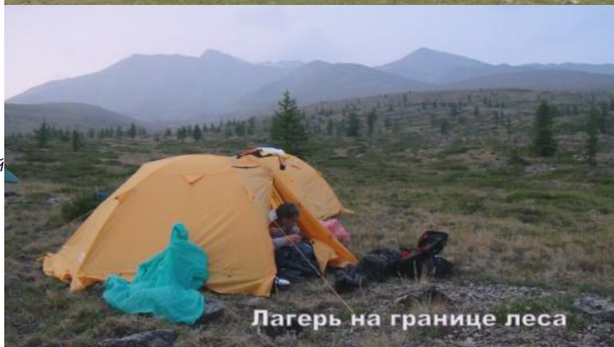
Лагерь на границе леса

- В акции, которая была приурочена к 70-летию Победы в Великой Отечественной войне и 76-летию событий на Халхин Голе, нам предлагалось водрузить над вершиной Мунку-Сардык копию Знамени Победы во Второй Мировой войне. Желающих было много, но в эту экспедицию попали самые достойные. Вместе с нашими коллегами из Иркутска, Ангарска и других городов области покорять вершину отправились девять усольчан. Всего от Иркутской области участвовали около шестидесяти человек.