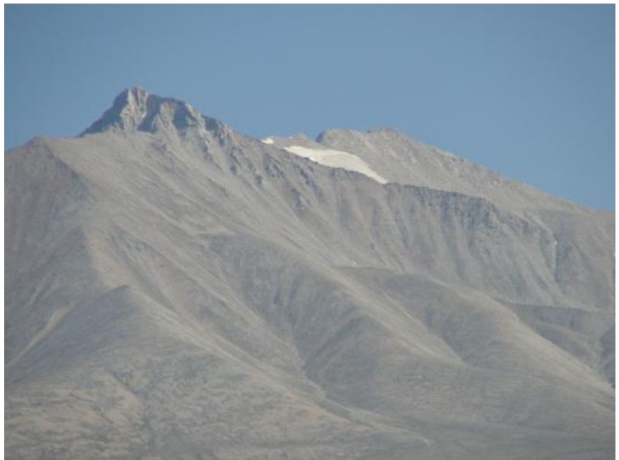
последний привал перед вершиной