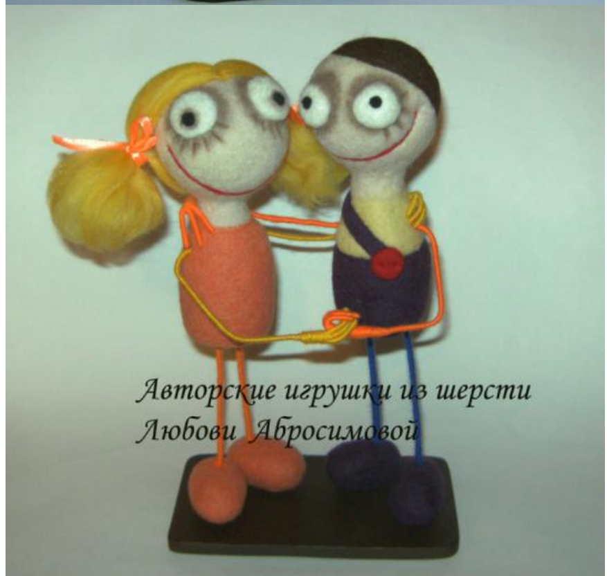
Авторские игрушки из шерсти Любови Абросимовой