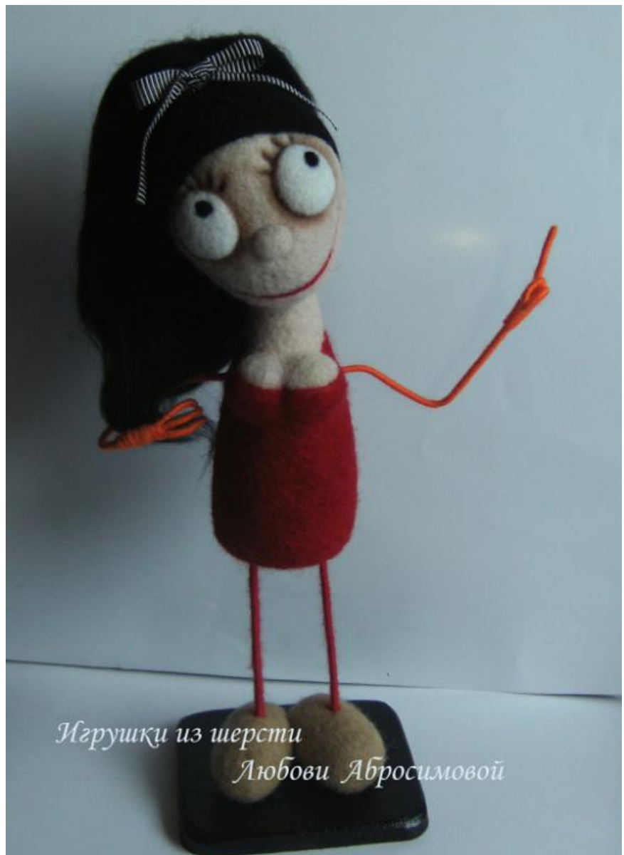
Игрушки из шерсти Любови Абросимовой