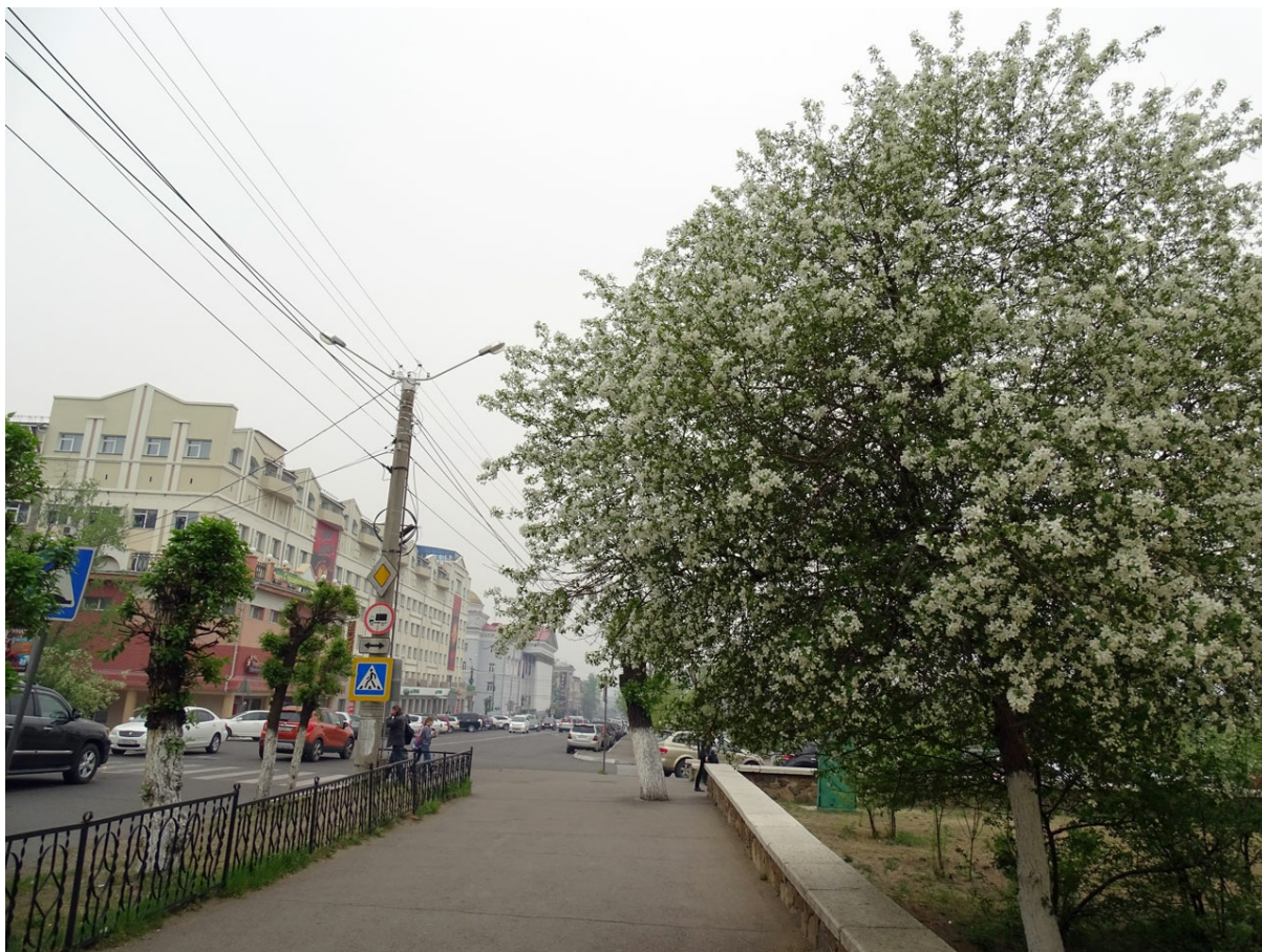
Центр Читы - блеклый, но в целом довольно опрятный.