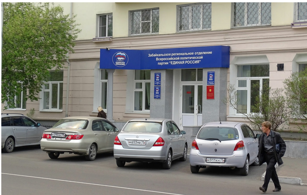
Скромненькое от здешних "медвепутов".