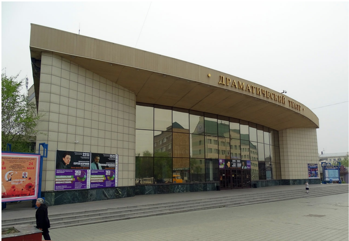
Монументально, но не сказать чтобы красиво.