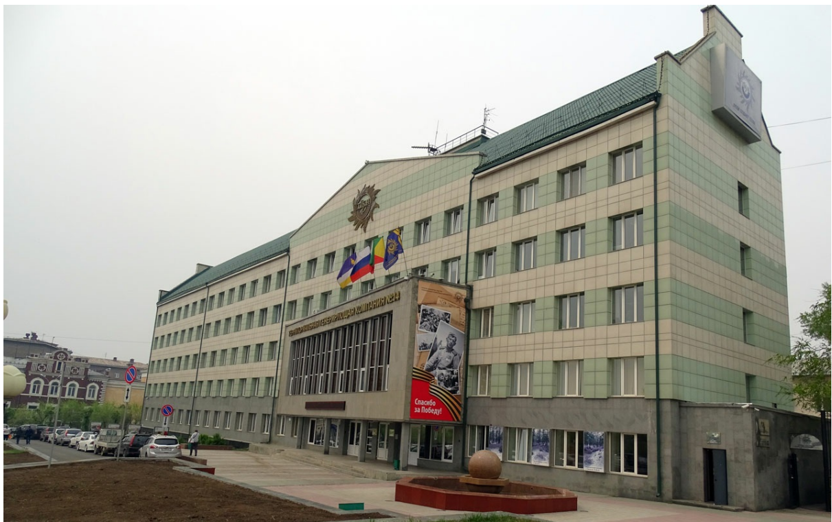
Здание Территориальной генерирующей компании. Говорят, энергетики имеют в городе большую власть.