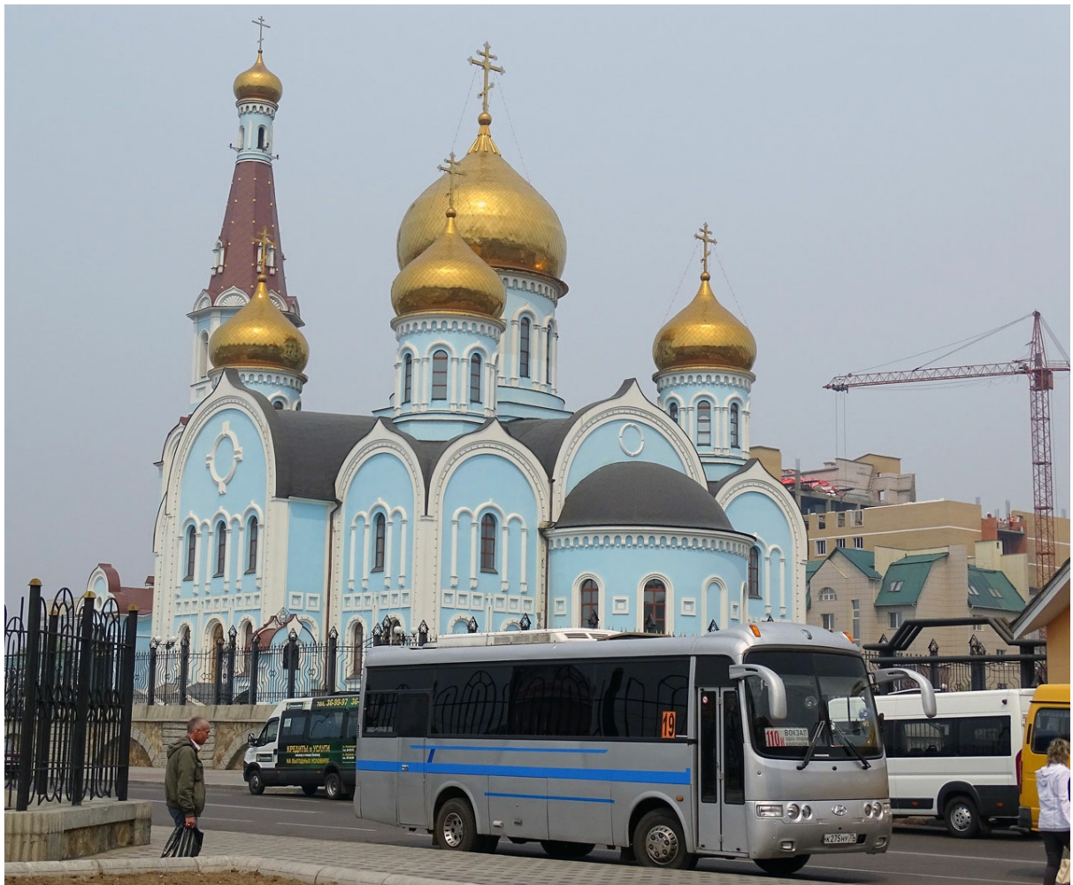
Кафедральный собор Казанской Иконы Божьей Матери. Одна из главных достопримечательностей Читы.