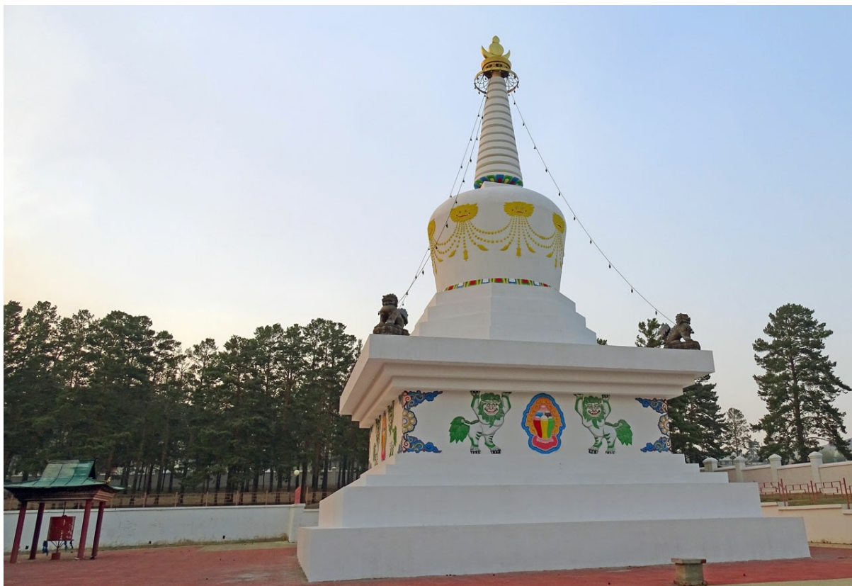
Большая ступа. Внутри - священные тексты, слитки разных металлов и другие предметы культа. Полым остается только небольшое пространство в основании верхнего конуса.