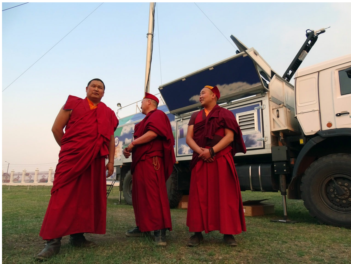
Монахи и высокие технологии

внушительная машина позволяет развертывать связь и скоростной Интернет в самых удаленных местах, а также в условиях разрушения местной инфраструктуры при чрезвычайных ситуациях и природных катастрофах.