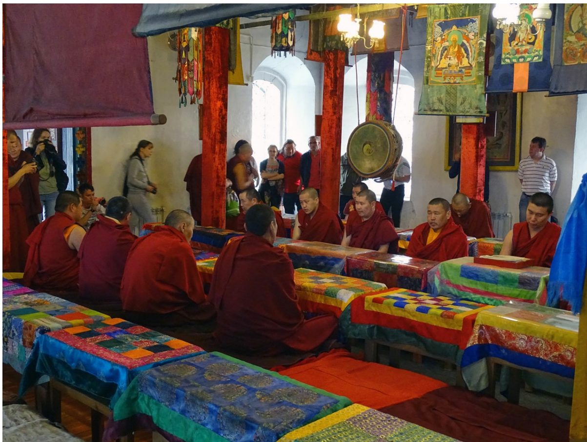
Вечерняя молитва в храме. Ничего общего с пышной сакральностью христианских служб и вычурным таинством мусульманских обрядов. Все просто, светло и достаточно незамысловато.