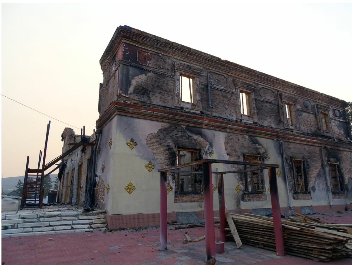
Тот самый старинный храм, простоявший около 200 лет и сгоревший в одну ночь 27 мая 2014 года. Монахи замечают по этому поводу коротко и емко: "Карма".