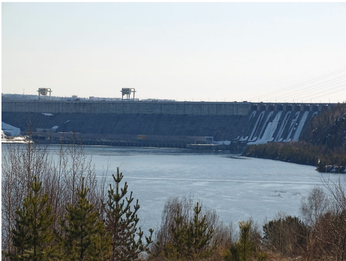
Усть-Илимская ГЭС. Впечатляет, хоть и не так, как Братская. Построить такую махину в глухой тайге - титанический труд.