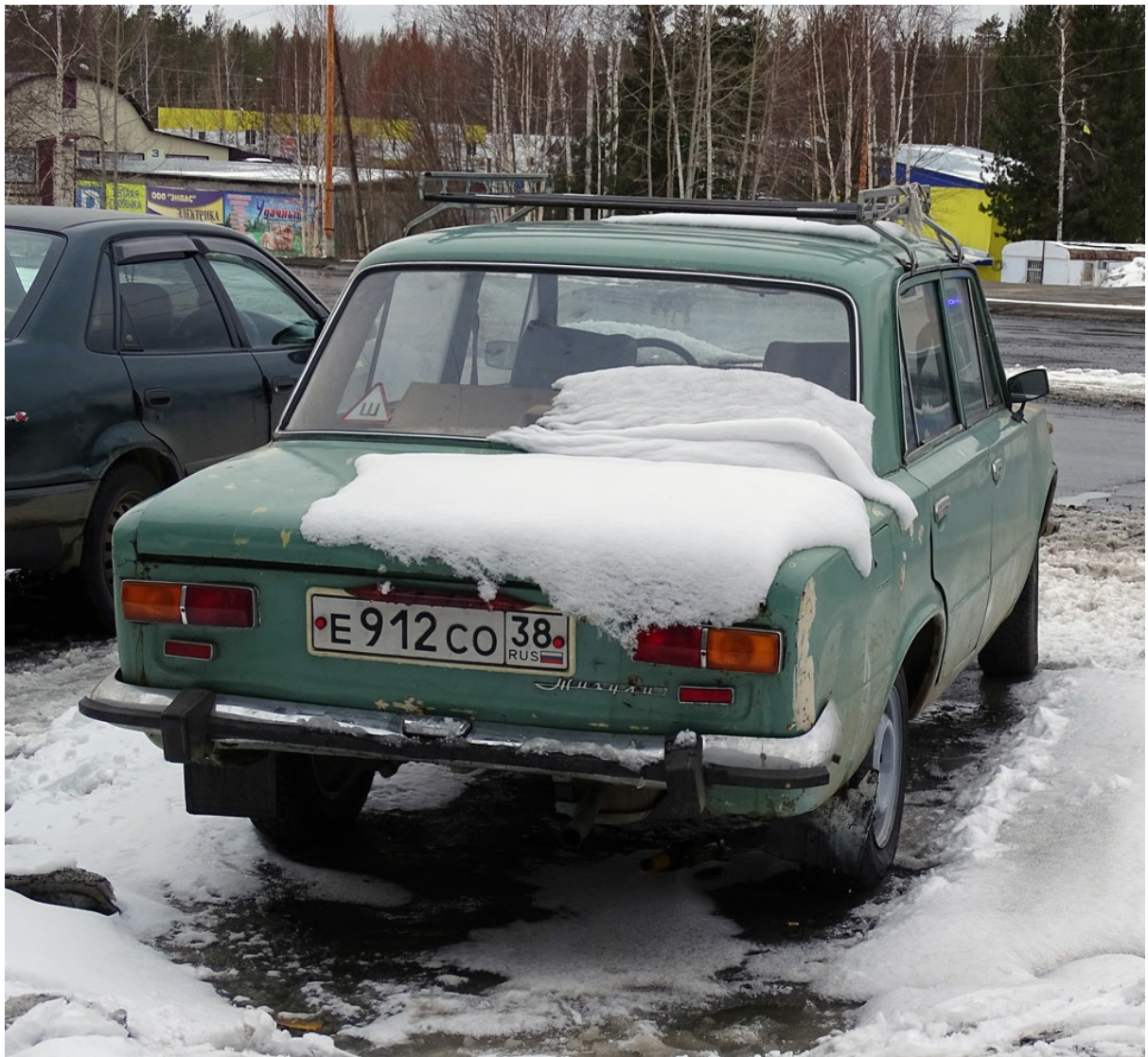
"Вазовская классика" ;)