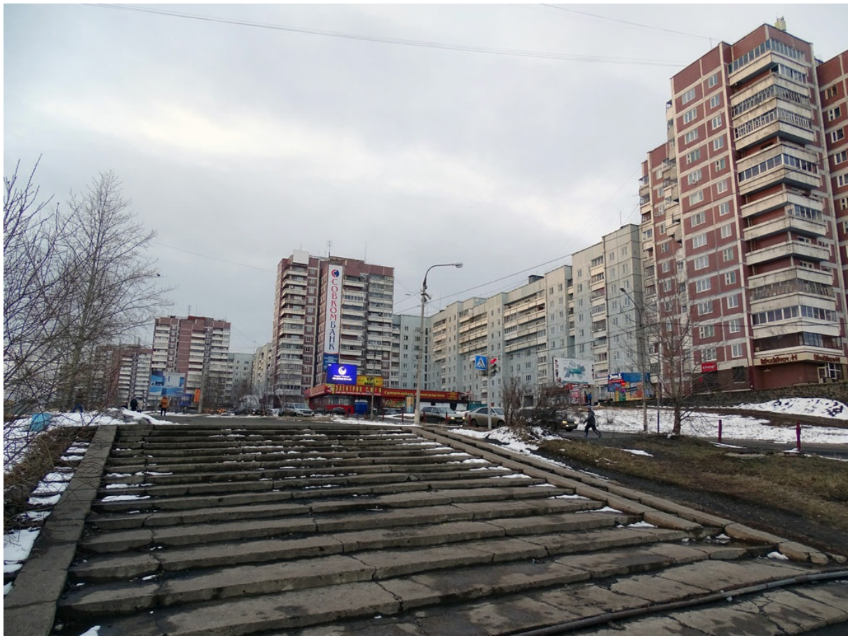
Усть-Илимск - просторный город советской застройки. В обрамлении тайги и крутых ангарских берегов строгие утилитарные кварталы кажутся уместным архитектурным решением.