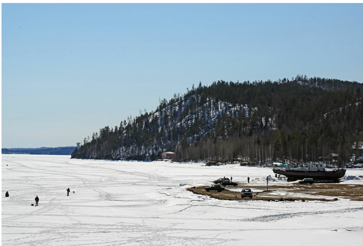
Верхний бьеф ГЭС. Ничего не напоминает? ;)