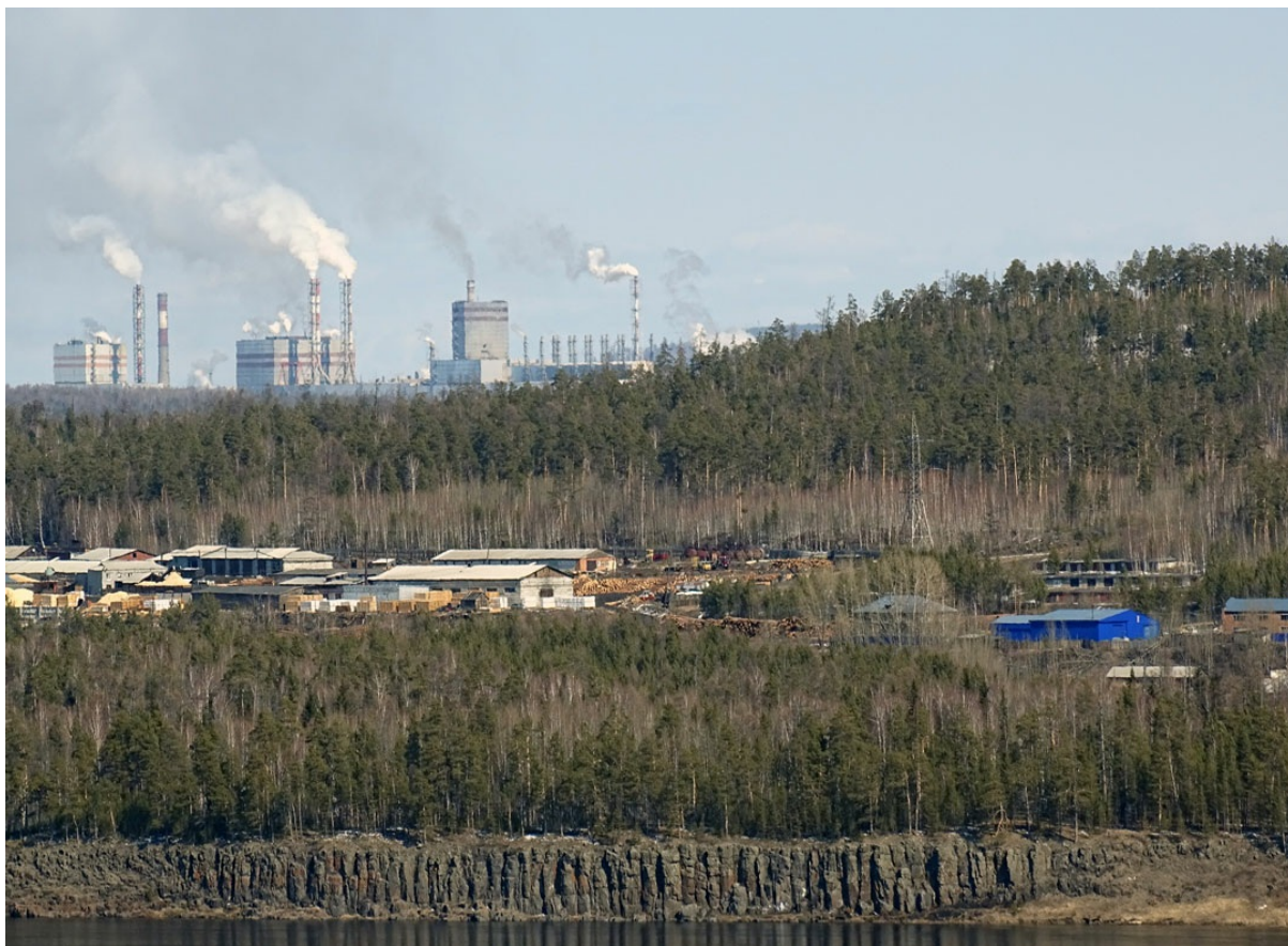
Усть-Илимский ЛПК. Принадлежит группе "Илим". Выбросы с ЛПК покрывают город с завидной регулярностью. Запах не из приятных.