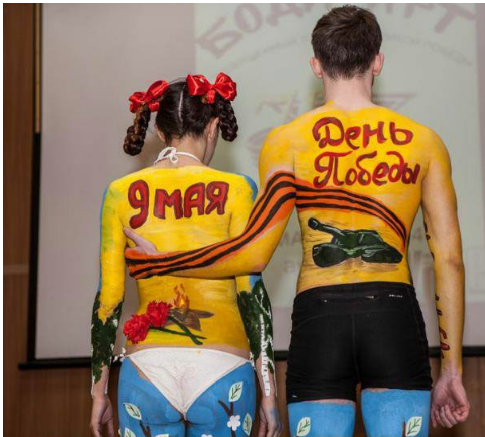
Конкурс боди-арта к 70-летию Победы, 2015 г. Ижевск