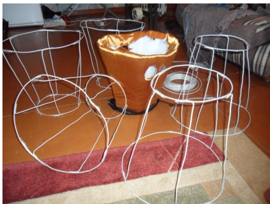
Процесс создания костюма.