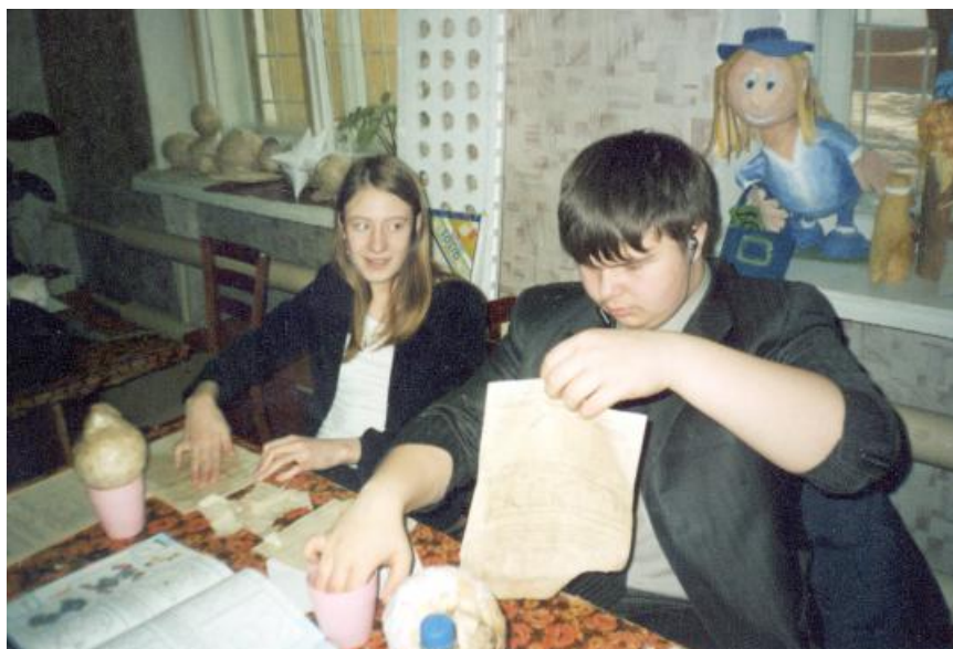
Творческое занятие в усольском лицее № 1.

Затем несколько лет она работала преподавателем черчения в лицее № 1, а еще лицеисты вместе с ней изучали предмет «Прикладное творчество». Руководители лицея позволили хрупкой женщине с тихим голосом делать все, что ей хочется, а ей хотелось учить детей любить родной город, свою страну и русскую культуру. Пусть в масштабах одного учебного заведения, но она считает, ей это удавалось.