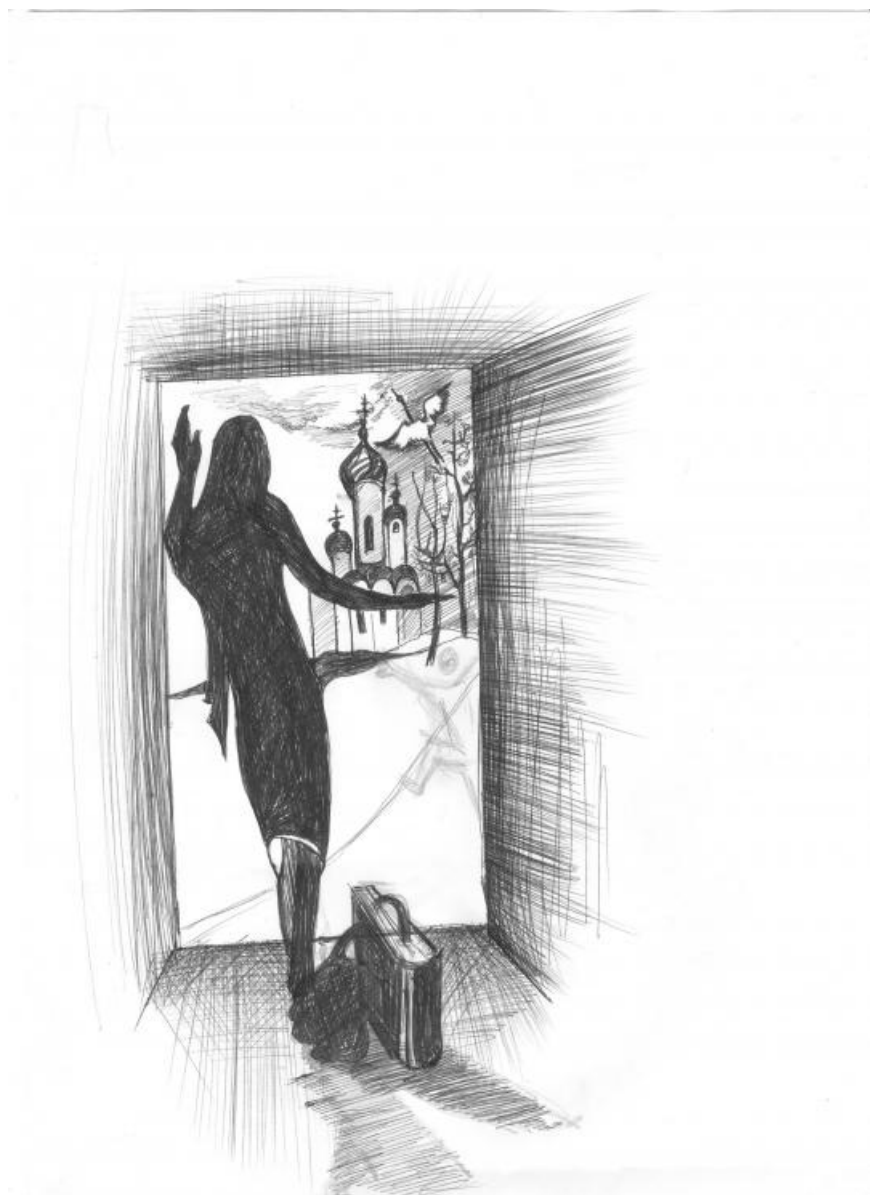
Рисунок к поэтическому сборнику педагога Детской школы искусств п. Белореченского Елены Зябловой.