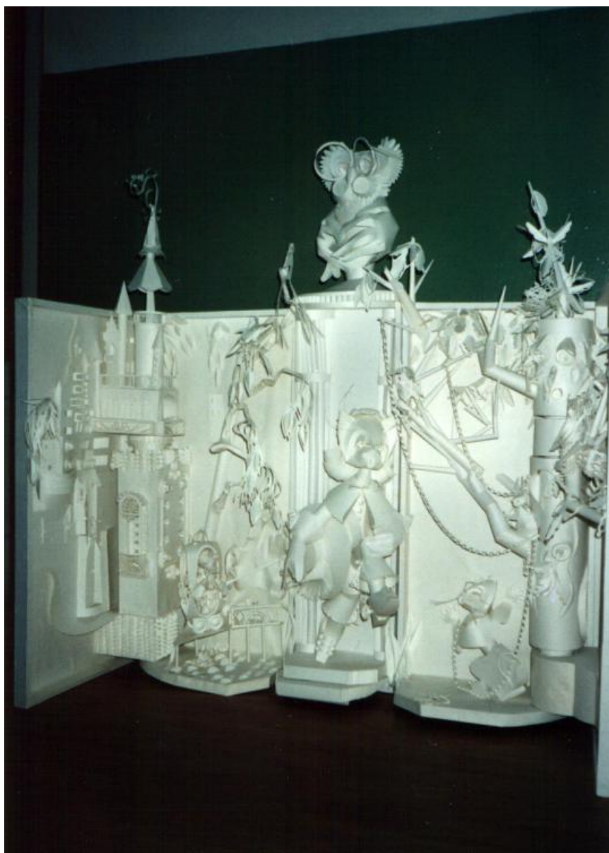
Бумагопластика. Дипломная работа.

В своей работе она просто купалась, настолько ей все это нравилось. Жизнь на Севере тогда кипела, приходилось оформлять сцены к различным праздникам, и делали это великолепно, несмотря на то, что и материалов нужных часто было не найти. Иногда сама удивлялась: как и из чего можно было сотворить такой шедевр? А как талантливы якутские дети, особенно дети-инвалиды, которые передают свои чувства и эмоции через рисунок. Группа ребят была с ней на протяжении всех школьных лет с первого по десятый класс; она учила их всему, что умела сама.