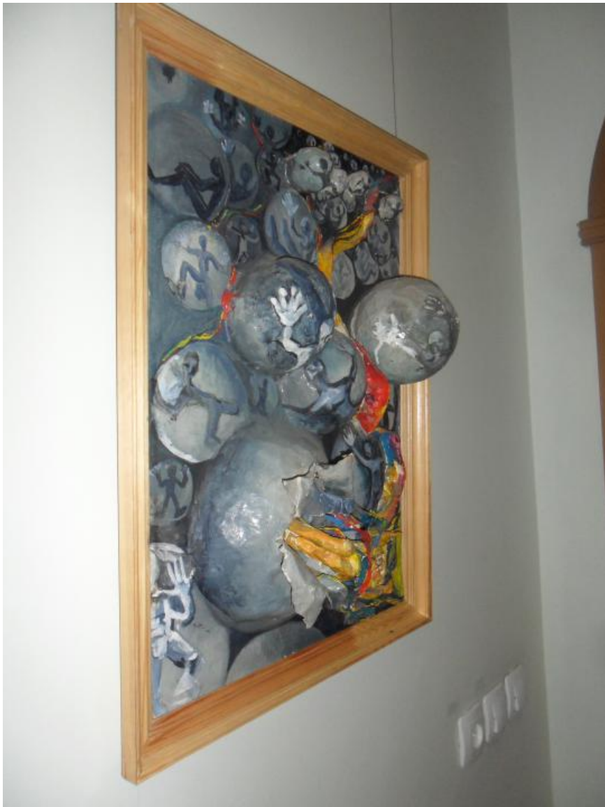
Работа из папье-маше.