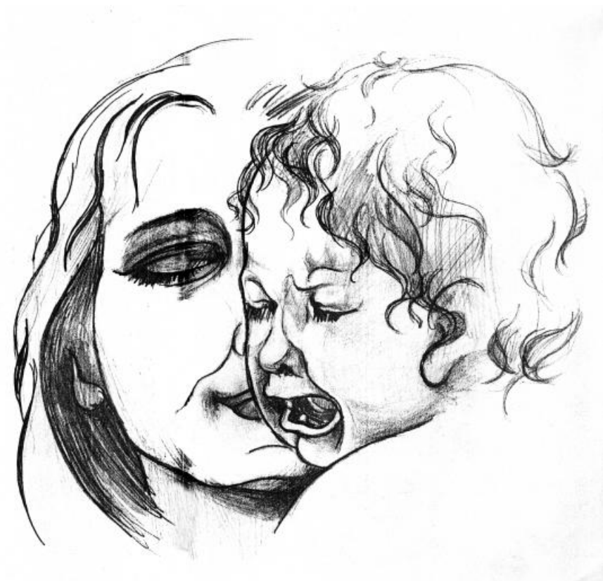
Рисунок Н.Кисловой к поэтическому сборнику педагогов лицей (2003 год).