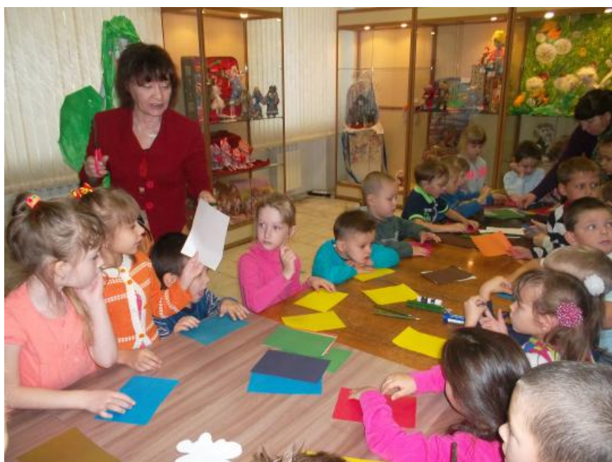
Занятие с дошколятами.