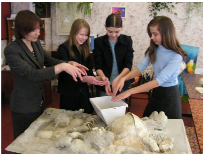
Работа лицеистов с папье-маше.