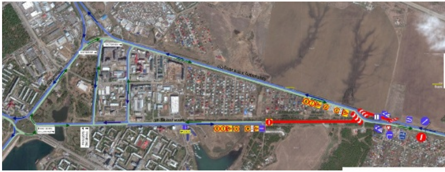
Космический фотоснимок места работ.