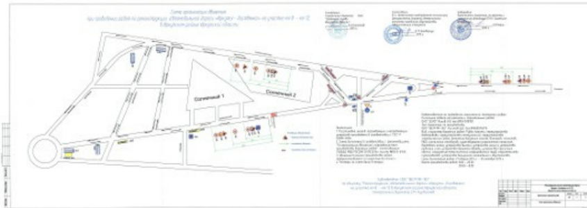
Схема организации движения при реконструкции дороги.