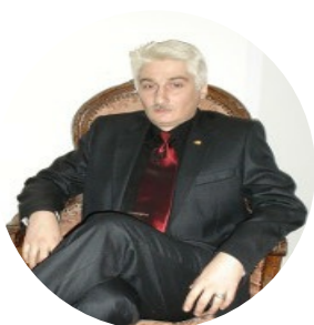
Автор текста: Роман Днепровский , обозреватель.