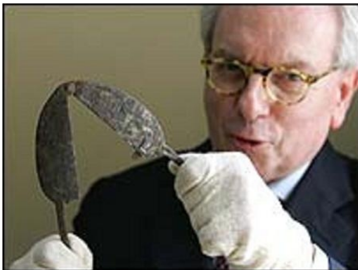
На фото: ритуальный скопческий инструмент, с помощью которого производилось "наложение печатей".