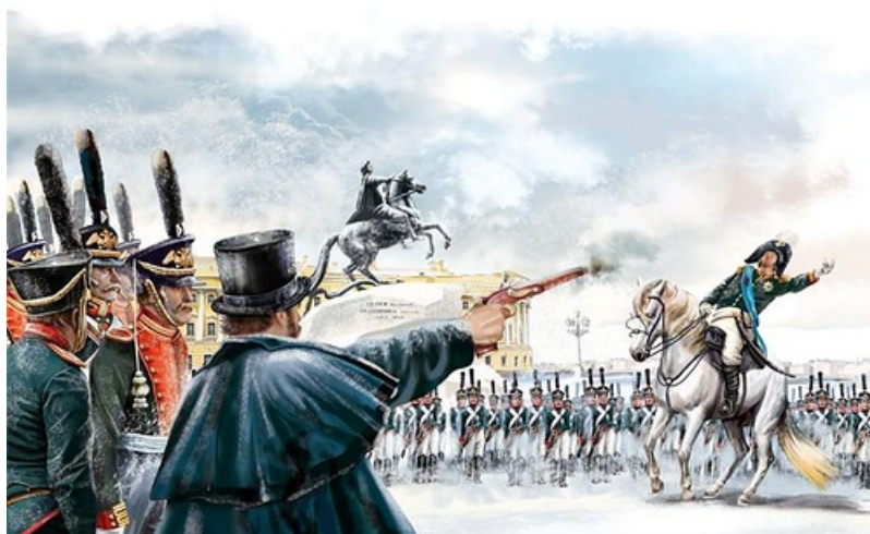
На фото: Каховский стреляет в графа Милорадовича, посланного к бунтовщикам в качестве парламента.