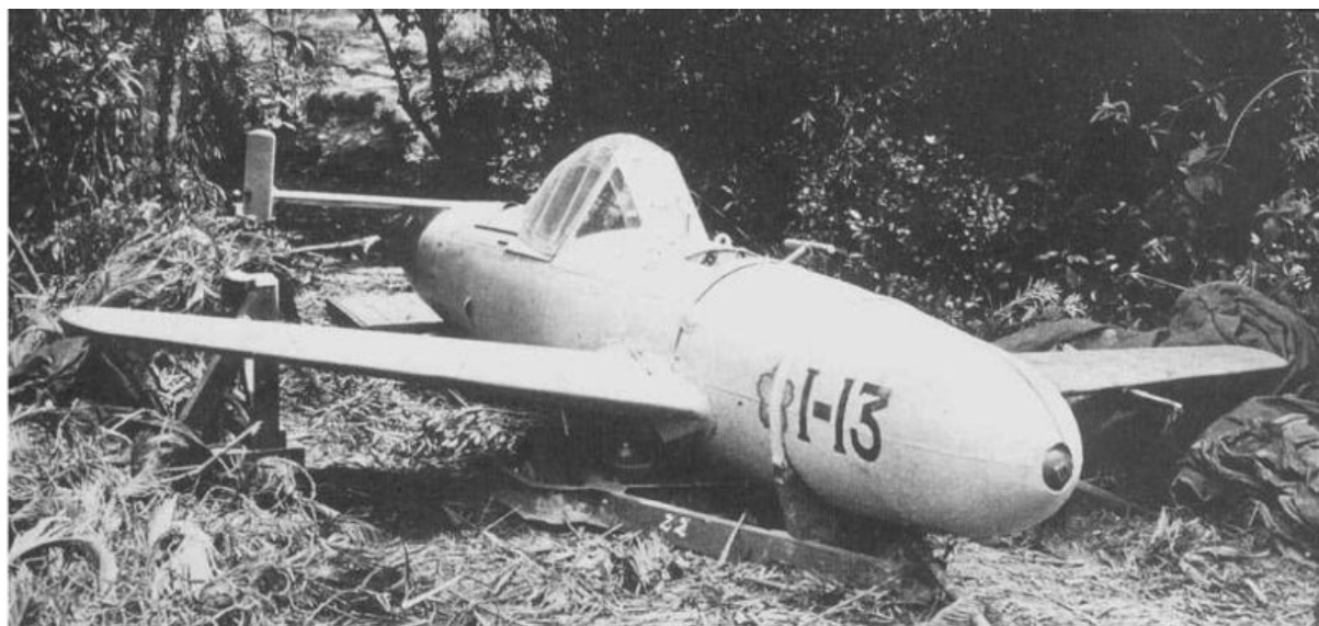
"Yokosuka MXY7 Ohka" (модель 11).