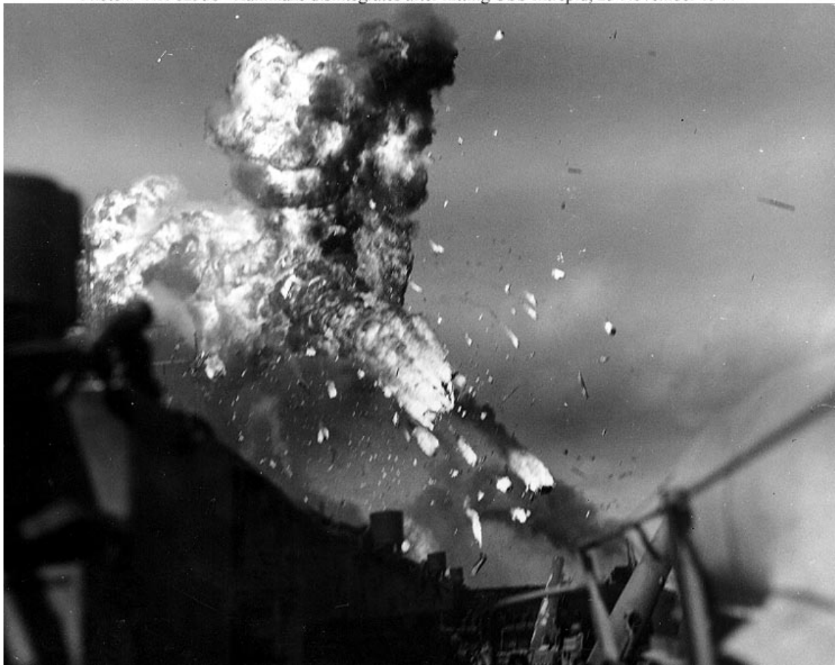
Атака камикадзе 25 ноября 1944 года.