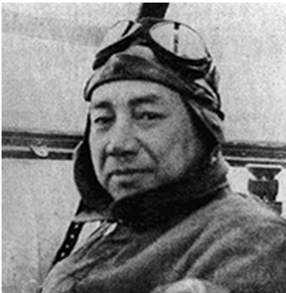
Вице-адмирал Такидзиро Ониси.