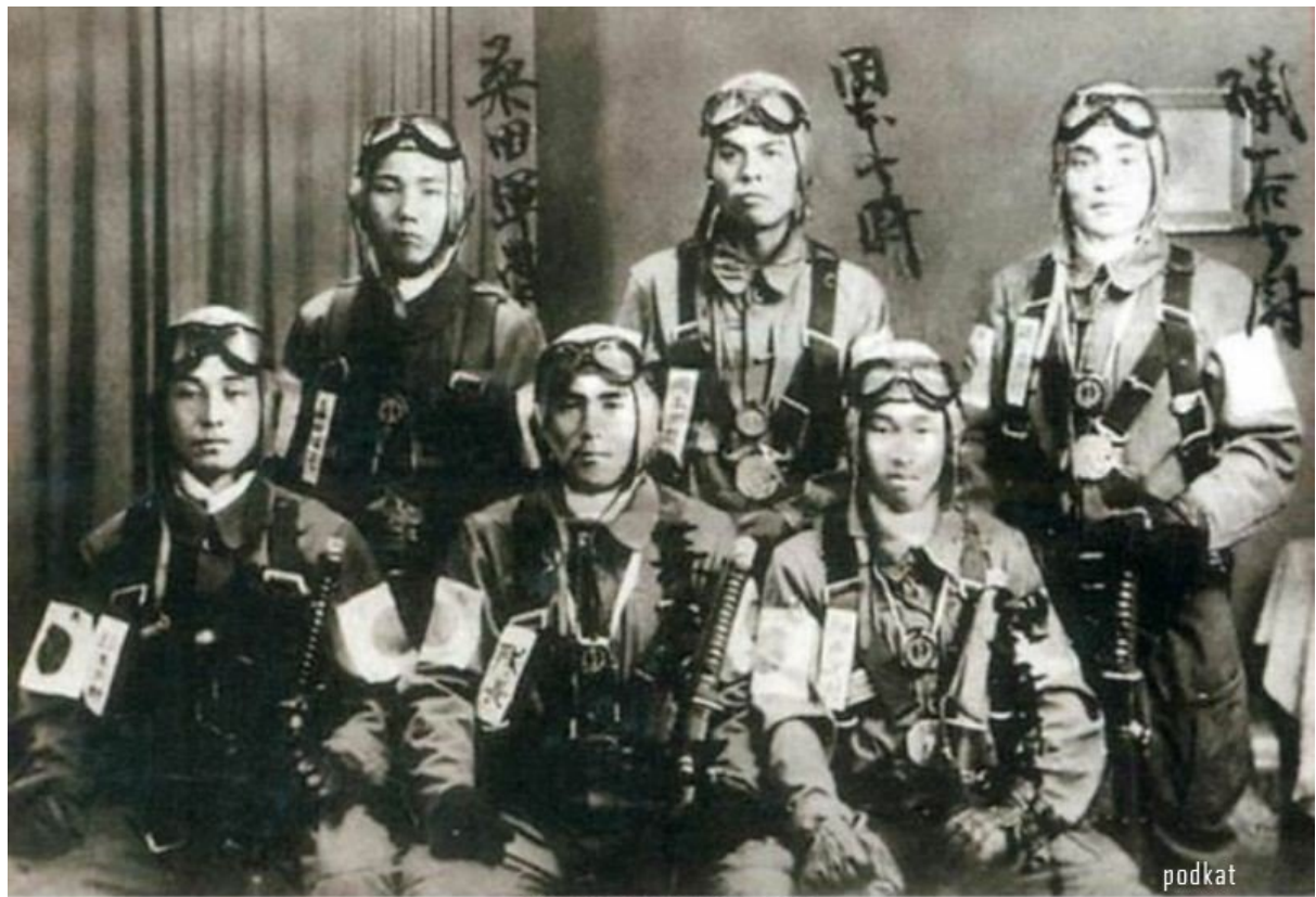
Накануне последнего вылета.