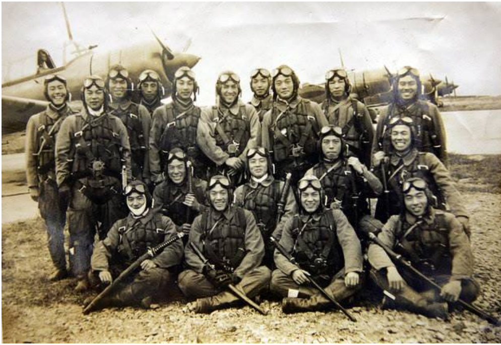
Пилоты-камикадзе на фото 1944 года, сделанном в городе Тёси (восточнее Токио), перед боевым вылетом в сторону Филиппин.