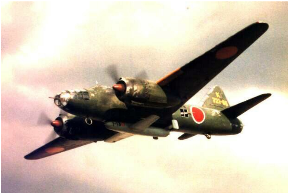
Бомбардировщик "Mitsubishi G4M2" из состава 701-го кокутая транспортирует "Yokosuka MXY7 Ohka".