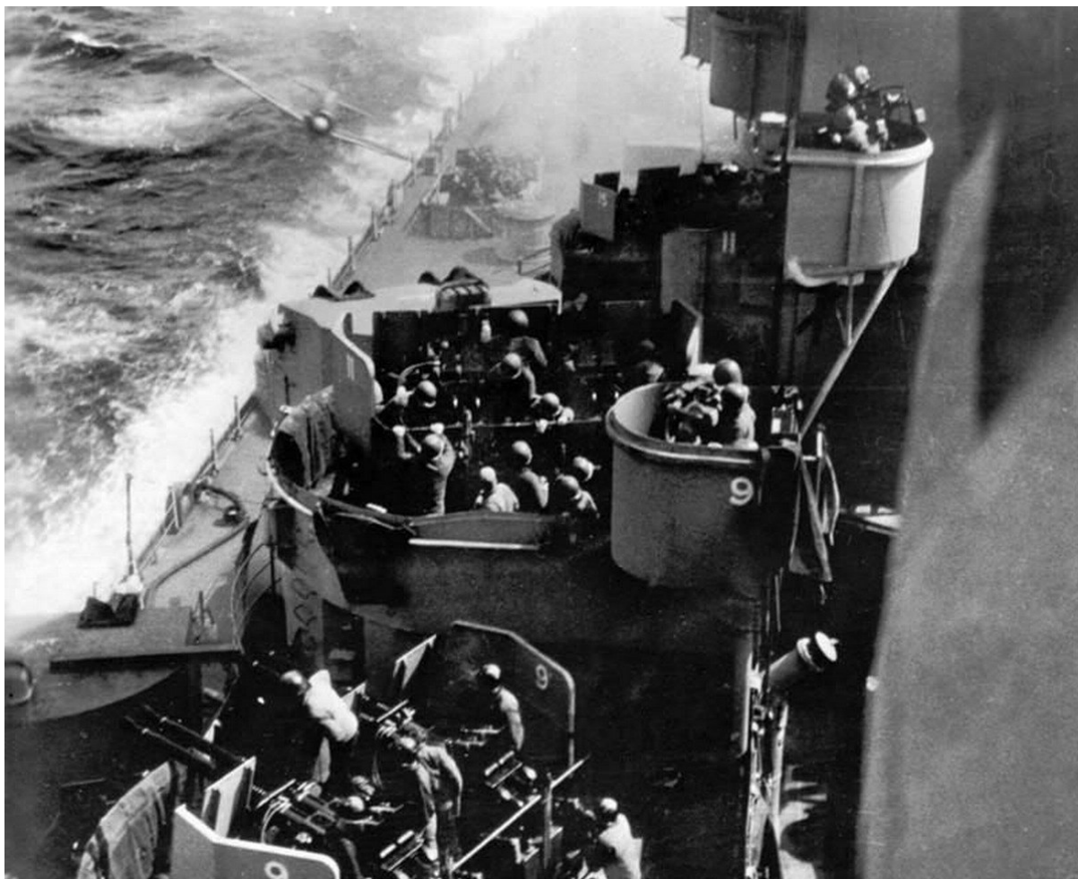
Атака камикадзе на линкор "Миссури".