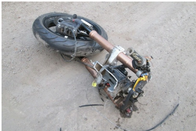
Порой от мотоциклов ничего не остается.