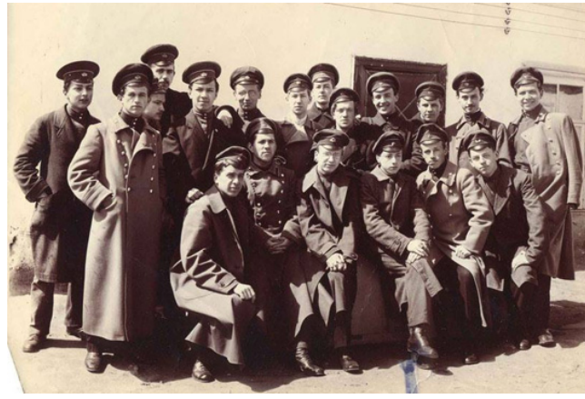
Гимназисты из 10-й московской гимназии. Снимок сделан предположительно в период между 1910 и 1916 гг.

Константин Кавелин: «Администрация царской власти заслонила и оттеснила эту самую власть на второй план и взяла самодержавие в свои руки. Засилье бюрократии связано с отсутствием самостоятельной церкви, подлинной аристократии и незначительной долей городского сословия. Однако решающее влияние оказывало невежество народа, огромная, несметная масса мужиков, не знающих грамоте, не имеющих даже зачатков религиозного и нравственного наставления».