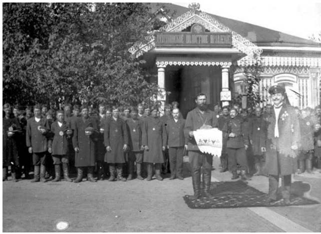
Ляпуновское волостное правление.

Русский образованный и европейский класс в начале XX века составлял всего 3-4 млн. человек, и он наивно перенёс свои представления об идеальном обществе на народ. В итоге сбылось пророчество Макса Вебера: «От романтического радикализма социалистически-революционной интеллигенции России – короткий путь в авторитарно-реакционный лагерь».