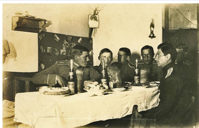
Офицеры Дроздовского полка празднуют Пасху. Крым, 1920г.

Если верен закон диалектики «о переходе количества в качество», то остро недостаточное количество образованных людей определило низкое качество государственного управления Российской империей. В. Ключевский (1911 год) с полным основанием писал: «Средства западно-европейской культуры, попадая в руки тонких слоёв общества, обращались на их охрану... усиливая социальное неравенство, превращались в орудие разносторонней эксплуатации культурно безоружных народных масс, понижая уровень их общественного сознания и усиливая сословное озлобление, чем подготавливали их к бунту, а не к свободе. Главная доля вины – на бессмысленном управлении».