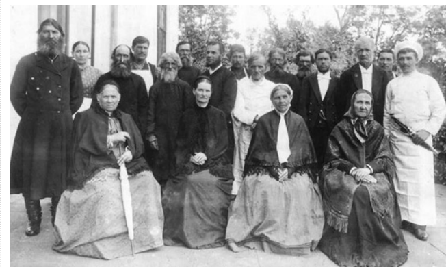
Крестьяне села Караул, служившие в усадьбе на Тамбовщине в конце XIX- начале XX века.

– О том, что население, в составе которого десятки миллионов неграмотных крестьян, не имевших ни малейшего представления о демократии, население, в котором доля образованных людей не превышала 3-4%, – способно существовать в рамках демократии, придерживаясь её норм в своей повседневной жизни.