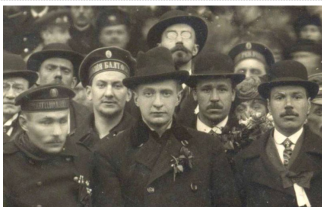
Керенский в окружении революционных толп

Отвергая утверждения экс-министра образования графа Д. Толстого, полагавшего, что у России «нет большой надобности в университетах», Д. Менделеев указывал: «и достойным нет входа в высшие учебные заведения из-за недостатка мест».