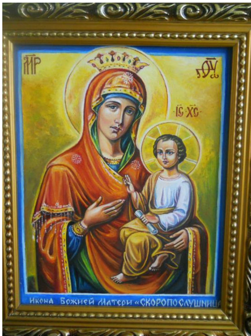
Икона Божией Матери «Скоропослушница»