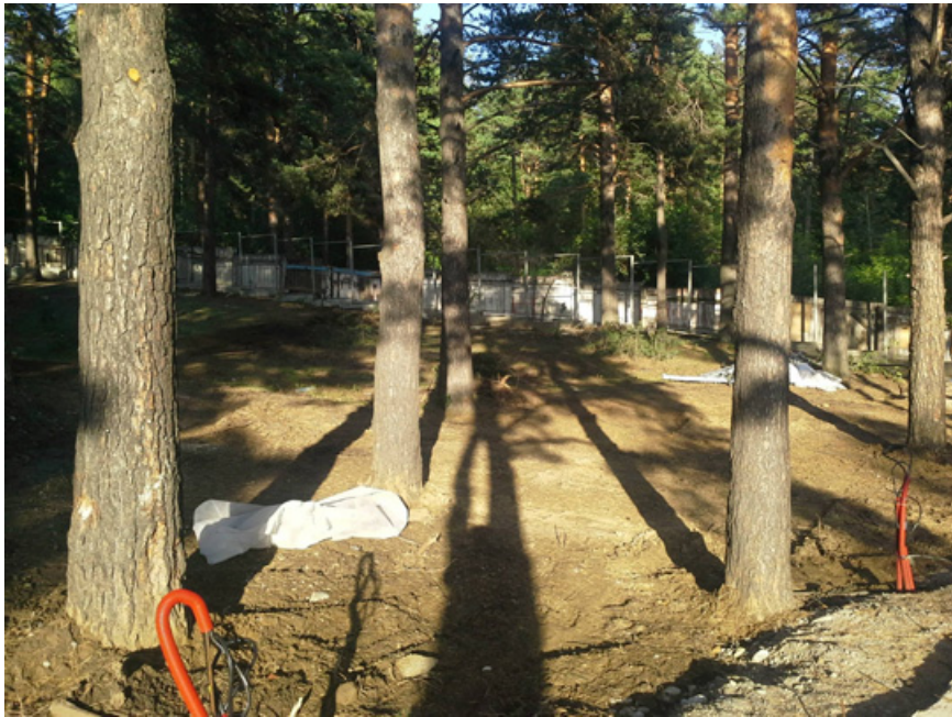
5. Разрушенный ландшафт участка соснового леса Кайской рощи около одиночного коттеджа РЖД. 9 августа 2014