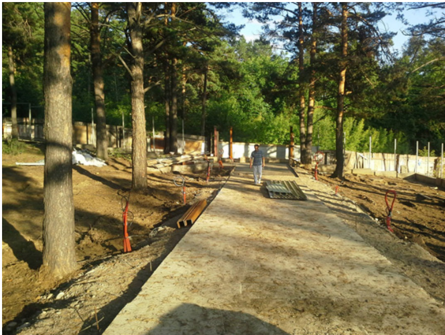
10. ПОСЛЕ прокладки бетонной дороги.

Автор: Артур Скальский © Babr24.com РАССЛЕДОВАНИЯ, МИР 👁 7320 13.08.2014, 15:51 📌 759