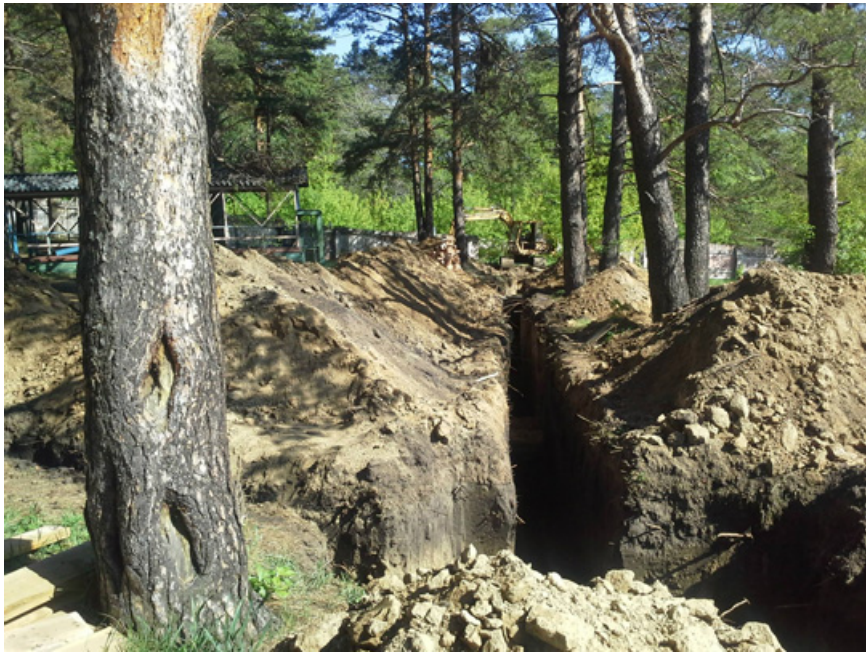
9. ДО прокладки бетонной дороги.