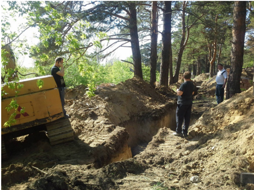
8. Прокладка линейного сооружения по участку соснового леса Кайской роци