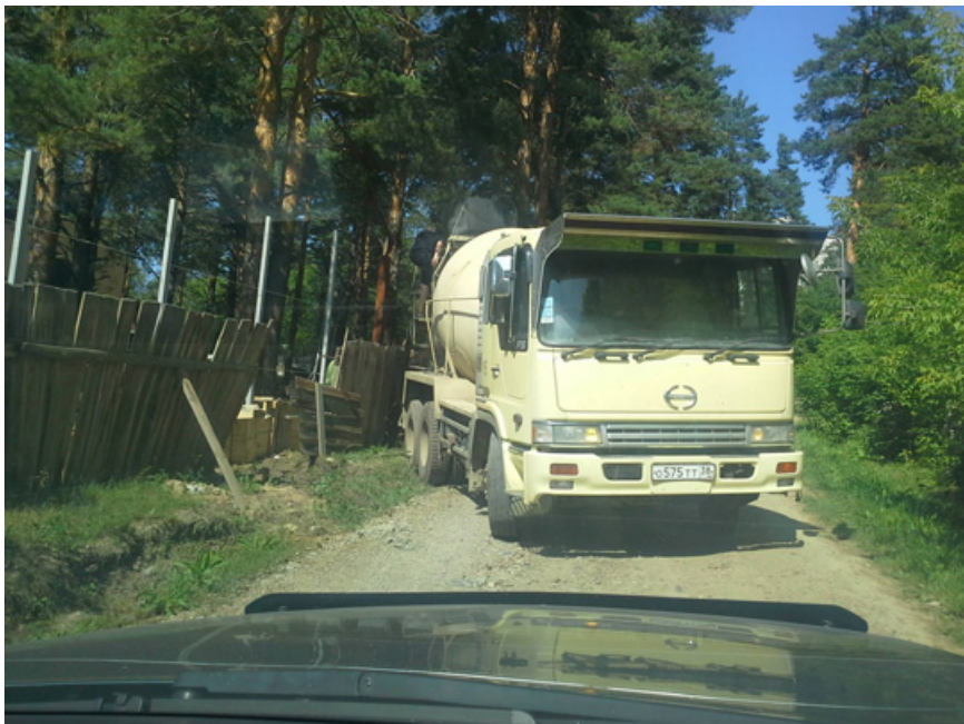
6. Бетономешалка, заехавшая без разрешения на территорию Ботанического сада ИГУ, очевидно, для заливки бетонного полотна дороги и выезда со стороны одиночного коттеджа РЖД. 9 августа 2014