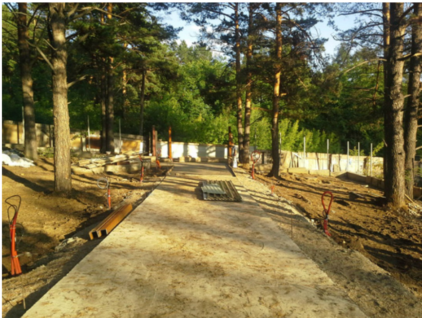
3, 4. Свежезалитая Бетонная дорога по другую сторону границы Ботанического сад со стороны одиночного коттеджа РЖД. 9 августа 2014 г.