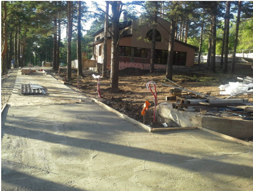
7. Свежезалитая Бетонная дорога по другую сторону границы Ботанического сад со стороны одиночного коттеджа РЖД. 9 августа 2014 г.