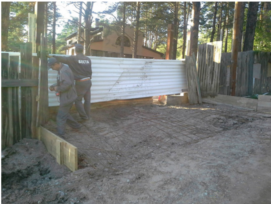
2. Строители устраивают несанкционированный и незаконный выезд с новыми воротами. Уложена арматура и изготовлена опалубка для заливки бетона и изготовления бетонного полотна дороги для выезда. 9 августа 2014 г.