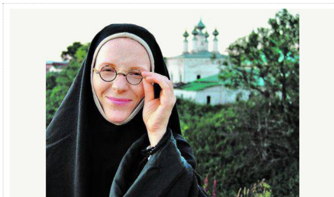
Киношный сыщик Пелагея

А с другой стороны, что вы хотели? Это ведь не сочинения Честертона. Это реальность, в которой если расследования и проводятся, то для поиска не столько преступников, сколько наличных. И если коррупция проникла во все общественные структуры, то почему же церковь должна быть исключением. Или все-таки должна?