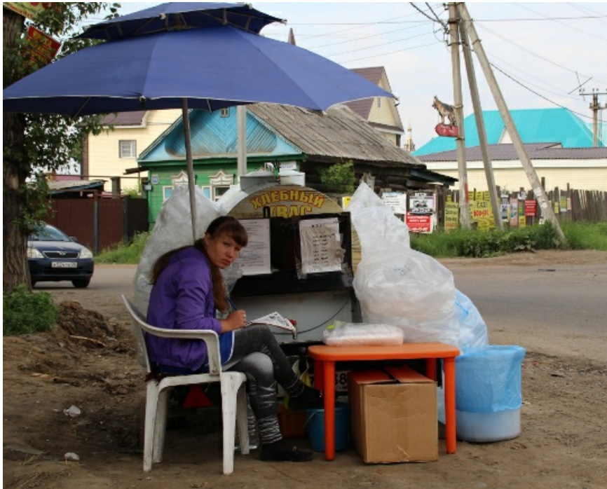
А вот и "рабочие места".