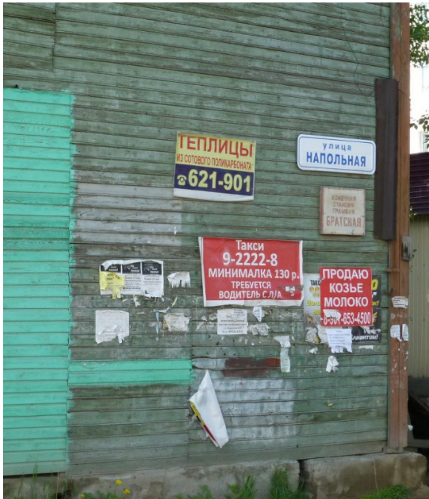
Местный аналог AVITO.