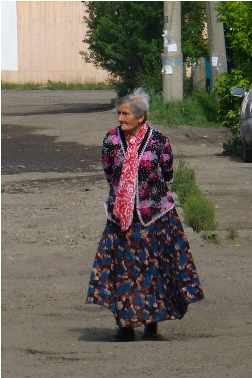
Модная старушка из местных.