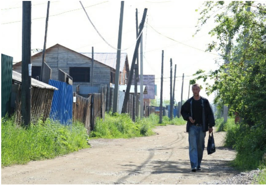
Мечта кубиста. На всей улице нет пары параллельных линий.