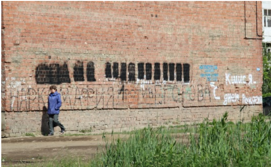
Борьба со спайсом.