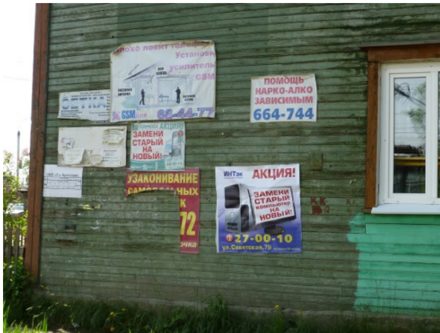
Помощь наркозависимым - это актуально. Хотя основной поток умер еще в начале нулевых.