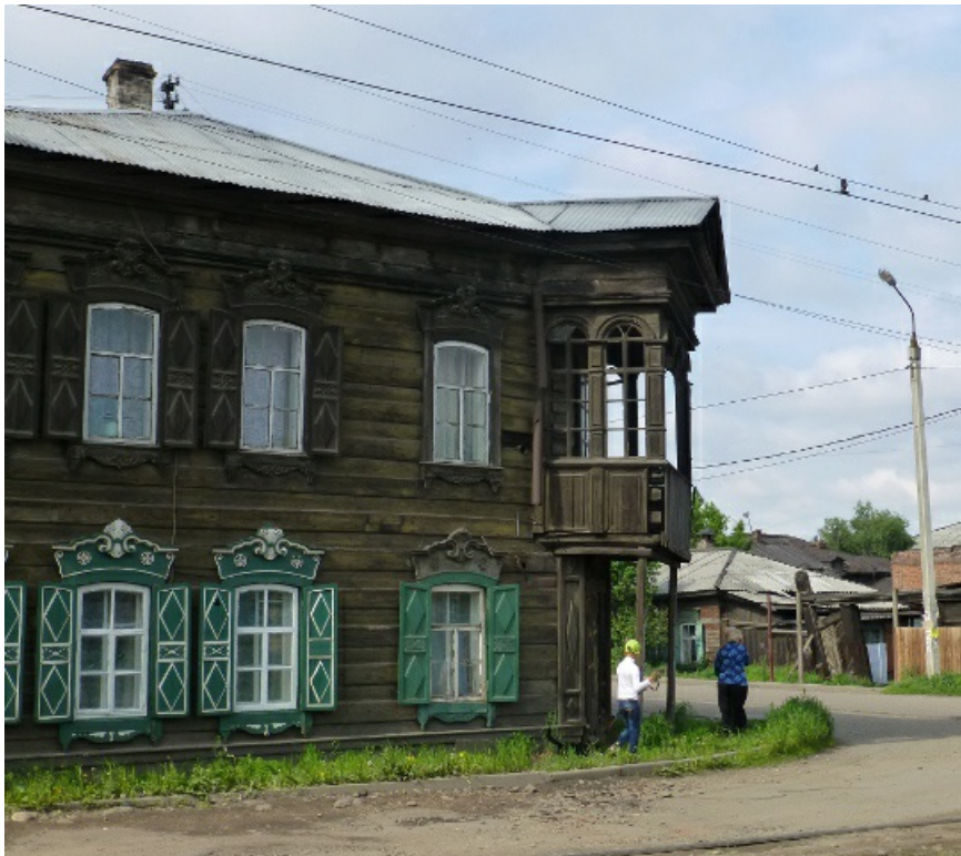
Некоторые домики так и просятся под федеральную охрану.