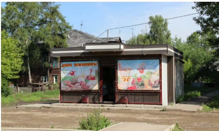
Водка продается 24 часа в сутки. Но только своим.