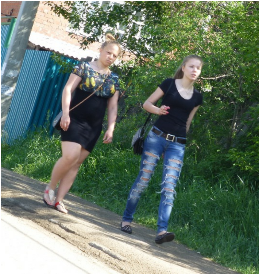
Местные барышни. Пока еще полны оптимизма.