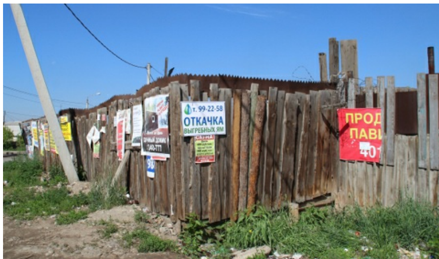
Хай-тек. Сколково отдыхает. XXI век, второе десятилетие.