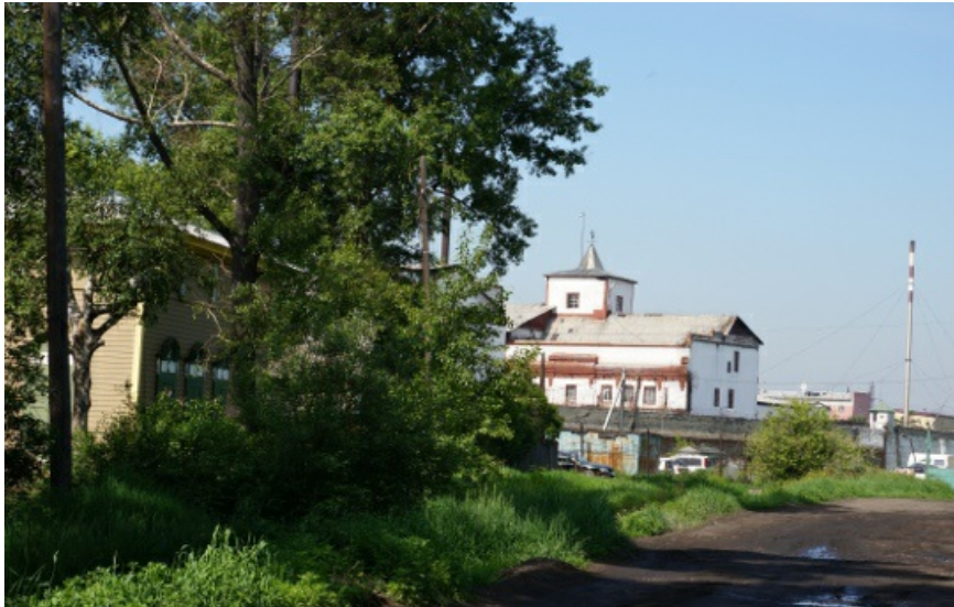
Дорога к тюрьме.