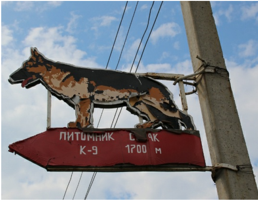
"К-9" - одно из немногих более-менее процветающих предприятий.