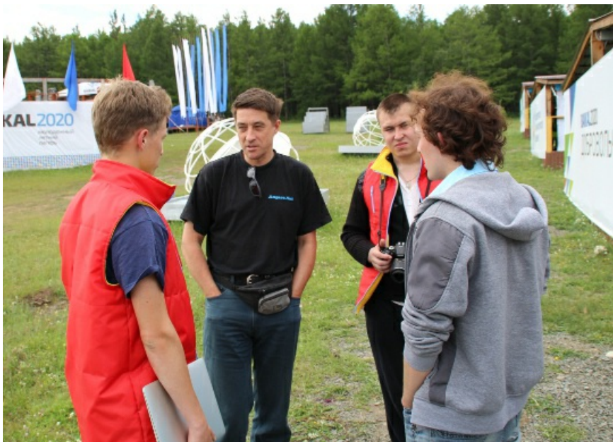
Некоторых экспертов буквально "рвут на части". В центре - специалист по информационным технологиям,