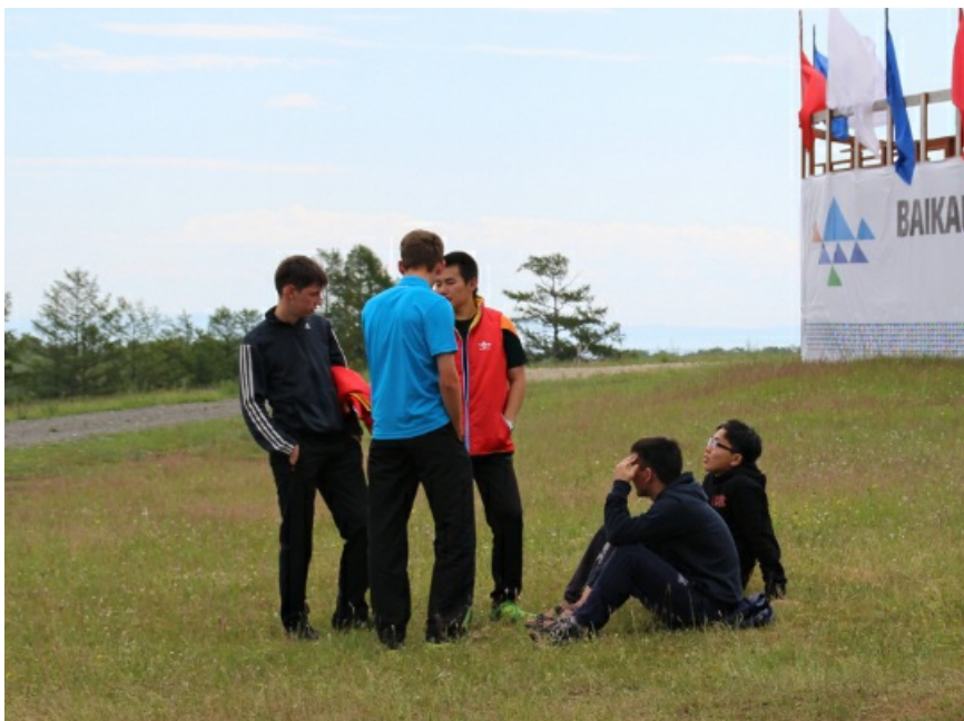
Бурные дебаты идут даже во время отдыха.