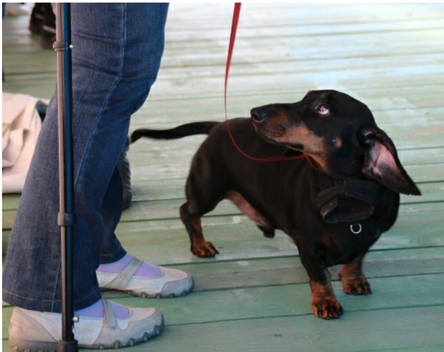
Единственное на весь лагерь четвероногое.