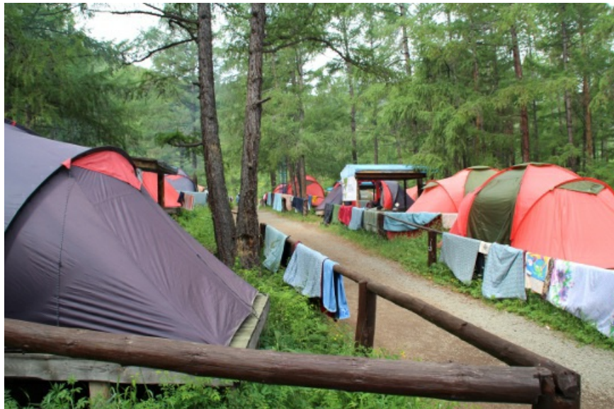
В чем нельзя упрекнуть организаторов лагеря - так это в экономии на снаряжении. Палатки, спальники, коврики есть на всех.