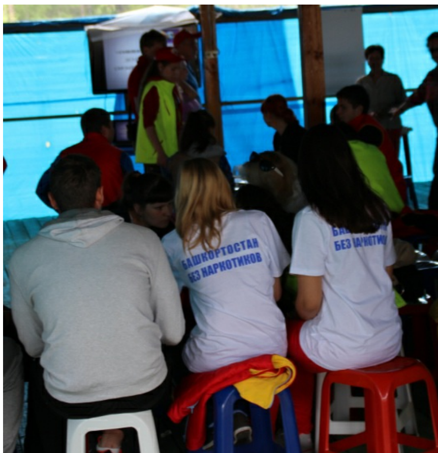
Наглядная демонстрация масштабности лагеря и географии его участников. Девушки из Башкирии.