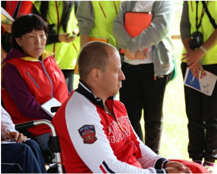
В 2014 году среди участников - большое количество инвалидов-колясочников.