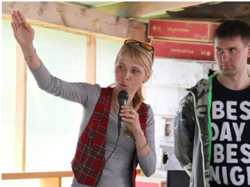
Направление, куда нужно идти.