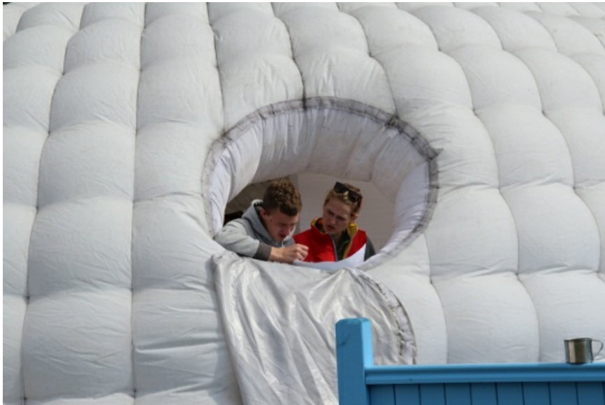
Надувной дом. Устройство бессмысленное, но интересное.