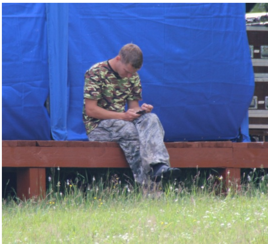
Участники не хулиганят - охранники скучают от безделья.