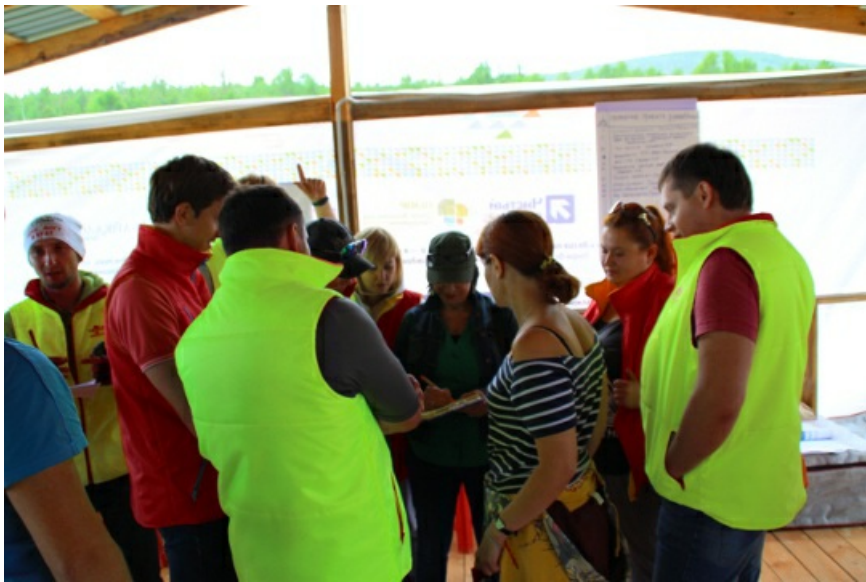
В разгар занятий.