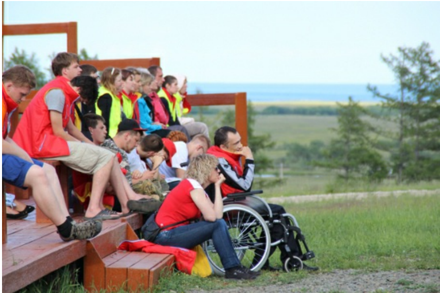
и его благодарные слушатели.