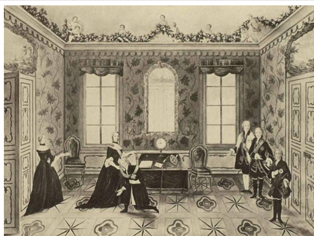
Возвращение графа Бестужева из подмосковной ссылки. Императрица Екатерина II принимает его 12 июля 1762 года в петербургском Летнем дворце