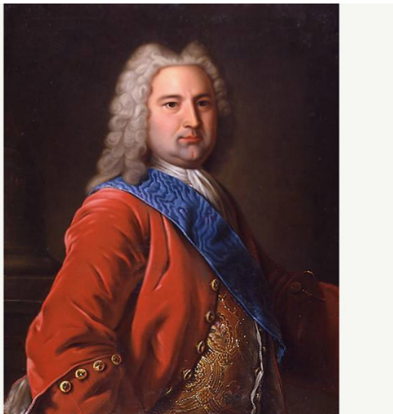
Бирон во время фаворитизма

Но и российский двор не оставался в долгу перед европейцами. Бирон первым среди россиян задумался над тем, что двору выгоден благоприятный имидж в западных СМИ. Европейские газеты тогда много писали о разного рода чудовищных фактах российской жизни – пытках оппозиционеров, повальном взяточничестве, самодурстве вельмож. Бирон тратил на подкуп европейских СМИ (в первую очередь английских и голландских – так как эти страны были основными торговыми партнёрами России) до 5 тысяч рублей в год.