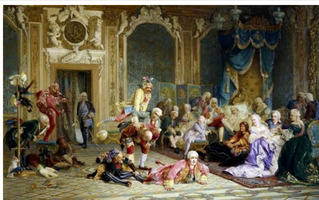
Двор Анны Иоановны

Так, Бестужев-Рюмин получал от англичан за лоббирование кабального торгового договора 2500 фунтов ежегодно, а голландские СМИ за PR России – 5000 рублей в год.