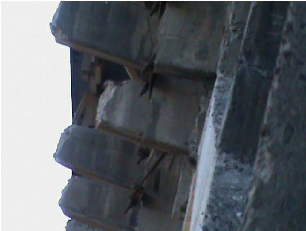
Состояние консолей моста. Часть из них обвалилось в Иркут.