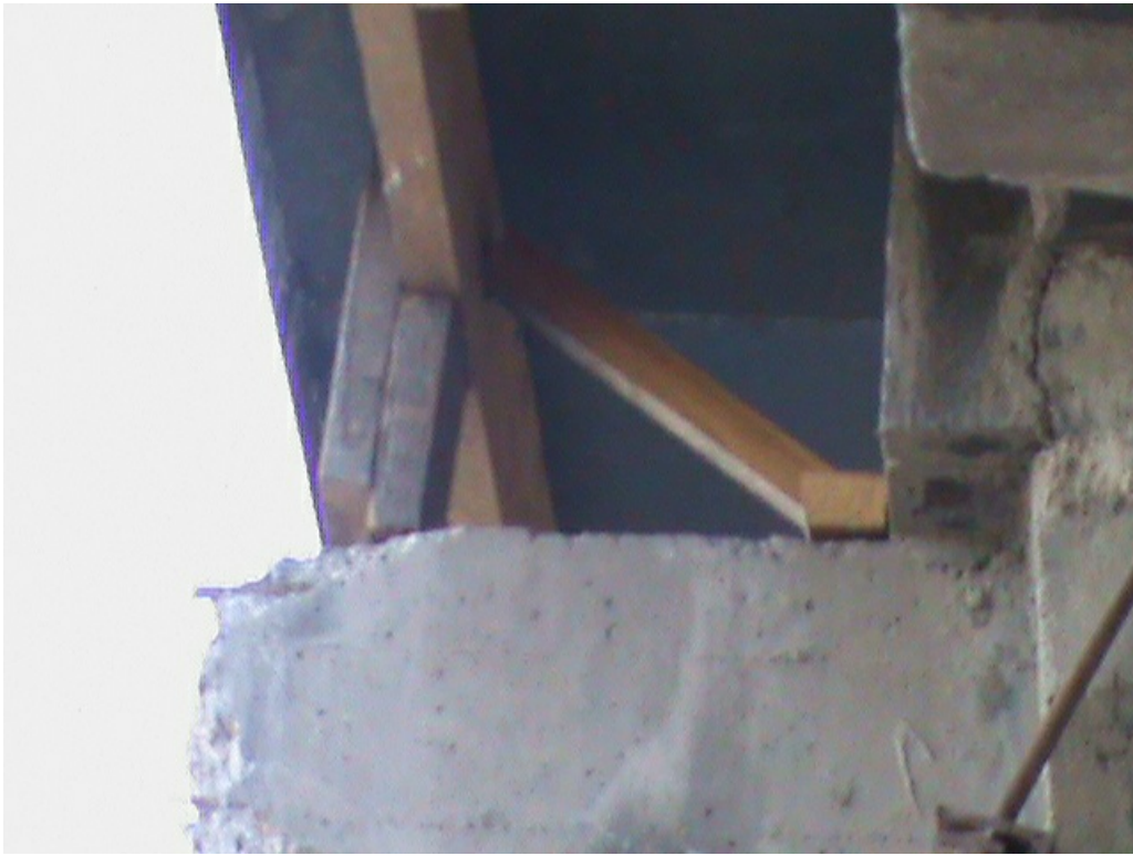
На таких дощечках держится многотонный тротуар после ремонта.