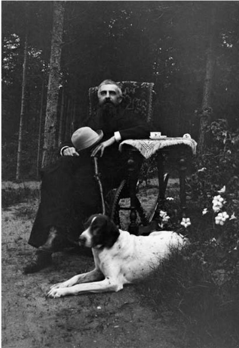
Философ Владимир Соловьёв

В дополнение к этой весьма недвусмысленной характеристике женской природы в своей теории небесной всеобъединяющей любви Соловьёв полностью исключил женщину как возможный субъект эротических отношений.