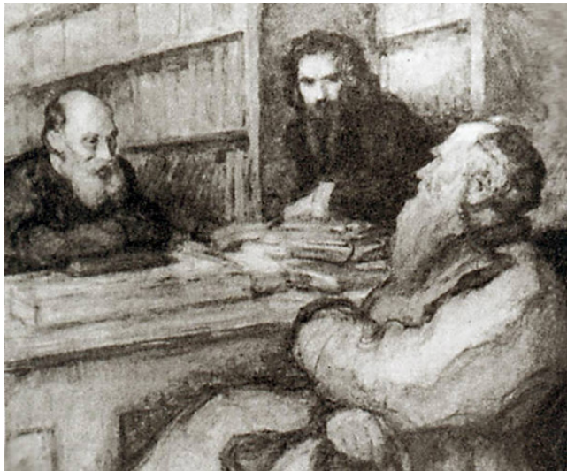
Николай Фёдоров, Владимир Соловьёв и Лев Толстой

Отрицание рождающего женского пола и утверждение культа девственного андрогина означали гибель женщины, материнства и природного мира. «Для грядущей мировой эпохи и для новой мировой жизни, – пророчил Бердяев, – женственность утверждается в аспекте девственности, а не материнства. Весь мировой кризис заостряется в роковой гибели материнства, а тем самым и материи. Наступает футуристически-технический конец религии рода, религии материнства и материи, и нет сил охранить и предотвратить от гибели родовую, материнскую, материальную органическую жизнь».