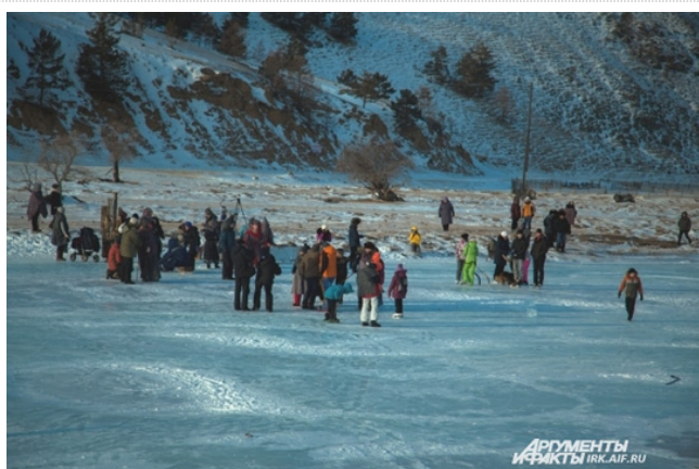
Каток на реке Бугульдейка

- Здесь постоянно дует ветер, поэтому те, кто любит пассивный отдых с максимумом удобств, сюда возможно и не поедут. Но это только плюс. Значит, будут приезжать те, кто хочет отдохнуть душой. Но мы рады всем, местные ветра за сутки способны выдуть городскую дурь из любого, - поделился Сергей.