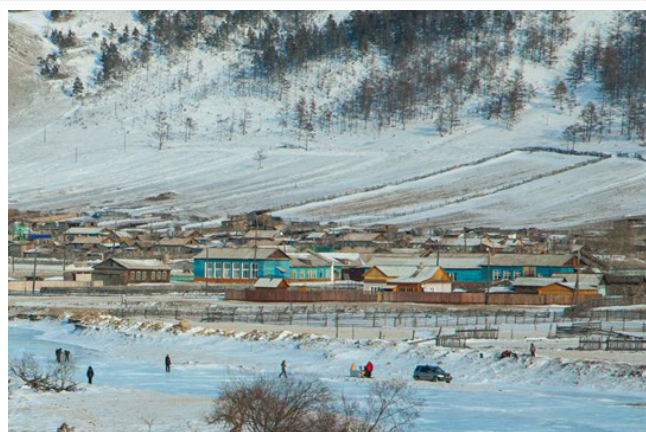
Бугульдейка словно лежит в чашке меж холмов

В трех часах езды от Иркутска на побережье Байкала еще осталось место, практически не тронутое современной цивилизацией. Бугульдейка расположилась в живописном месте между высоких холмов на западном берегу великого озера.