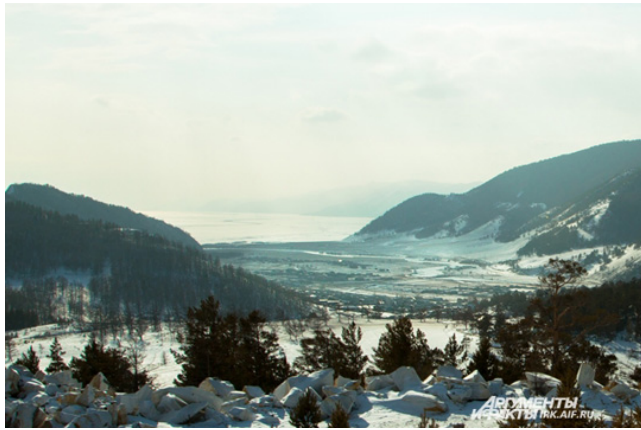
Вид на Бугульдейку