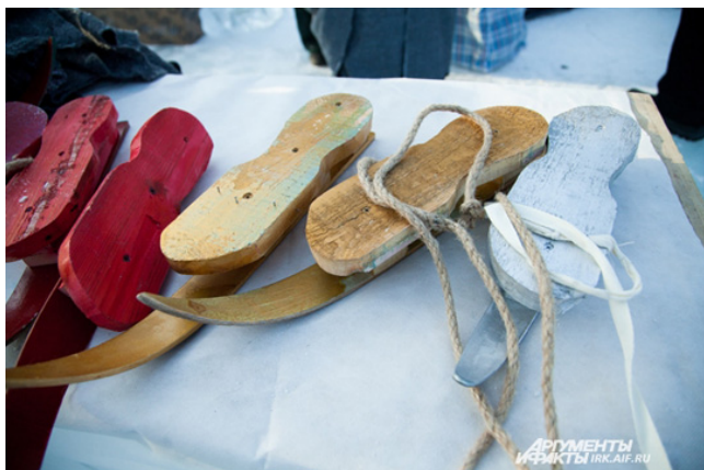
Коньки привязывают к обуви обычными веревками

Помогать передвигаться на деревянных коньках помогали специальные клюшки – точно такими пользовались во времена голландского художника Брейгеля. Но и это не все - мастерицы пошили костюмы эпохи ренессанса из самой обыкновенной ватинной подкладки для пальто! В этих костюмах дамы и кавалеры, неуверенно стоящие на привязанных к обуви коньках, не оставляли сомнений: перед нами ожившие полотна Брейгеля.