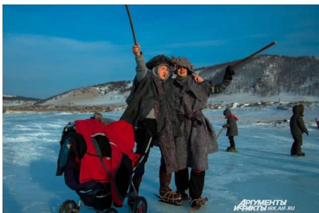
В Бугульдейке мороз, но некоторые не побоялись привезти сюда своих малышей

Помогать передвигаться на деревянных коньках помогали специальные клюшки – точно такими пользовались во времена голландского художника Брейгеля. Но и это не все - мастерицы пошили костюмы эпохи ренессанса из самой обыкновенной ватинной подкладки для пальто! В этих костюмах дамы и кавалеры, неуверенно стоящие на привязанных к обуви коньках, не оставляли сомнений: перед нами ожившие полотна Брейгеля.