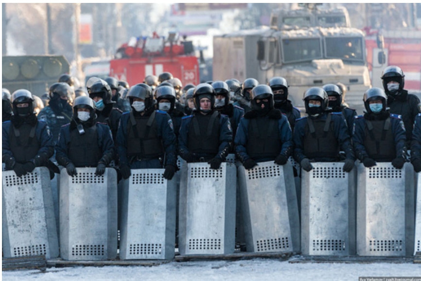
24. "Идите домой!"