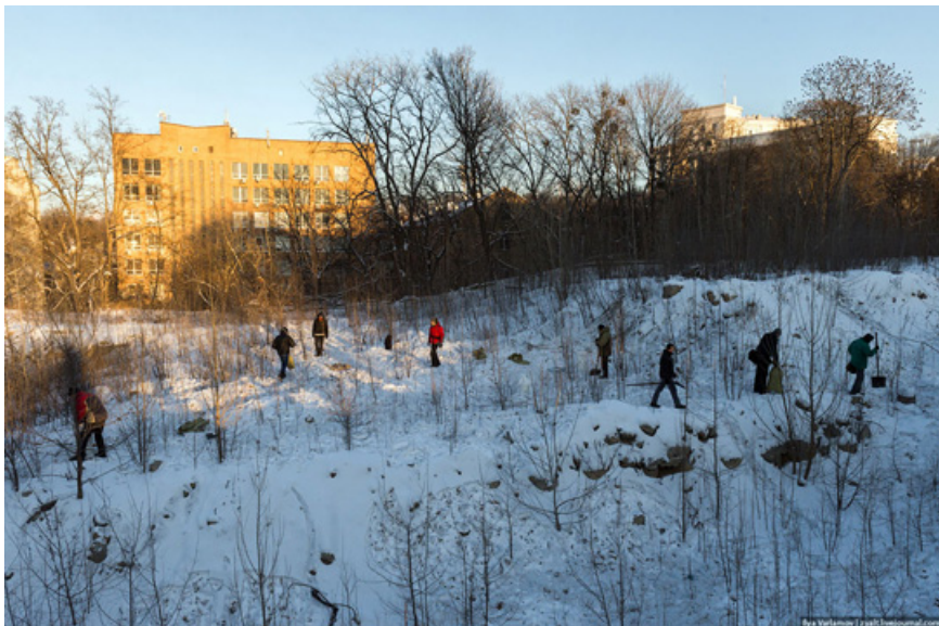
33. Закат над Майданом.