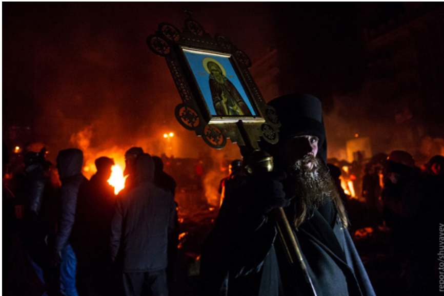
37. Перемирие кончилось с наступлением ночи. Опять полетели камни, бутылки и гранаты.