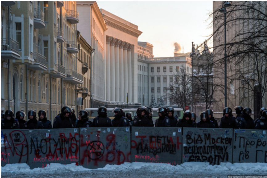
32. Активисты Майдана собирают снег в мешки - главный стройматериал Майдана.