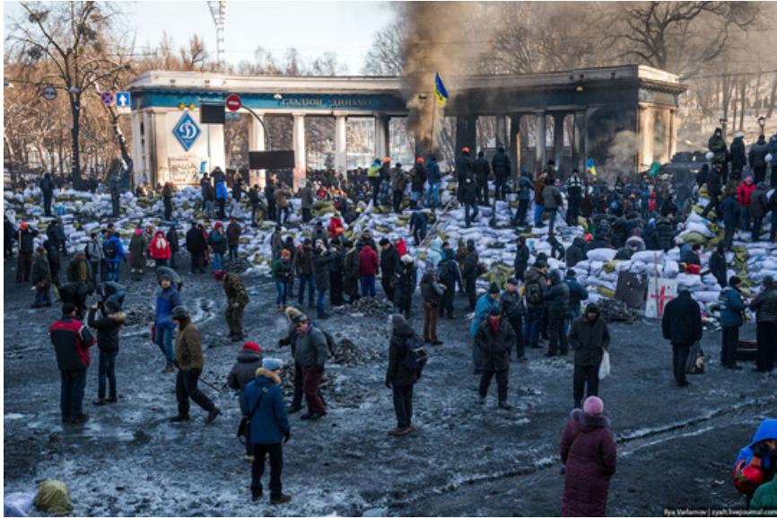
31. На Банковской, где находится администрация президента, тоже оцепление. Там милиционеры совсем неразговорчивые оказались.