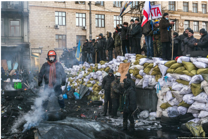
23. Оцепление правительственного квартала.