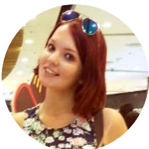
Автор текста: Валерия Маяковская , редактор

Связаться с редакцией Бабра: newsbabr@gmail.com