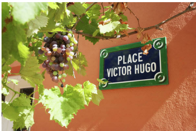
Табличка "Площадь Виктора Гюго" во дворе дома Пьера Гюго в Экс-ан-Провансе

— Главная наша традиция в семье — уважать себя и уважать других. Это очень важно, а все остальное — наживное. И конечно, мы обязаны, являясь потомками такого великого человека, как Виктор Гюго, всем внушить к нему такое же уважение, какое сами испытываем. Это наш долг. Поэтому очень жаль, что в 2002 году я проиграл один процесс — в год 200-летия прадеда один современный автор написал продолжение "Отверженных". Подобного бы Гюго никогда не позволил — он даже в конце романа написал: "если этот финал нехорош, я навсегда уйду". И все же суд позволил той книге выйти в свет. Тогда я понял, что никто не знает, что такое "моральное право" — ни в юридическом мире, не в светском.