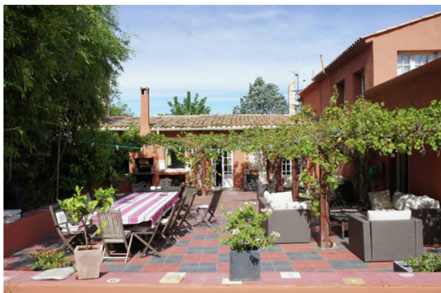
Двор дома Пьера Гюго в Экс-ан-Провансе

- Можете ли вы рассказать какой-то факт из биографии Виктора Гюго, который потряс вас самого больше всего?