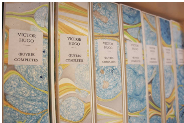
Старинные книги Виктора Гюго, собственноручно переплетенные его правнуком для своего собрания