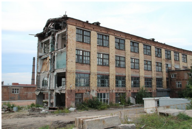
Излишки советской роскоши.