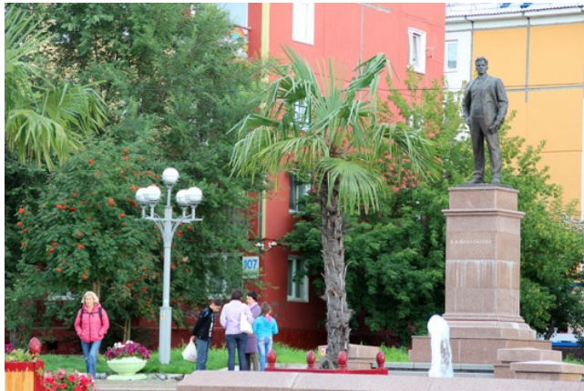
Владимир Владимирович среди пальм.