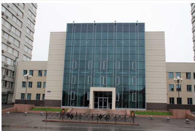
Законодательное собрание Красноярского края живёт своей жизнью - отдельно от исполнительной власти региона.