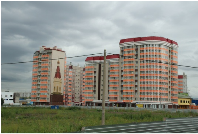
И снова часовня с 10-рублёвки.