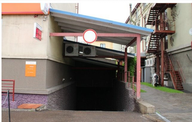
Сквозной проезд через цоколь категорически запрещён!