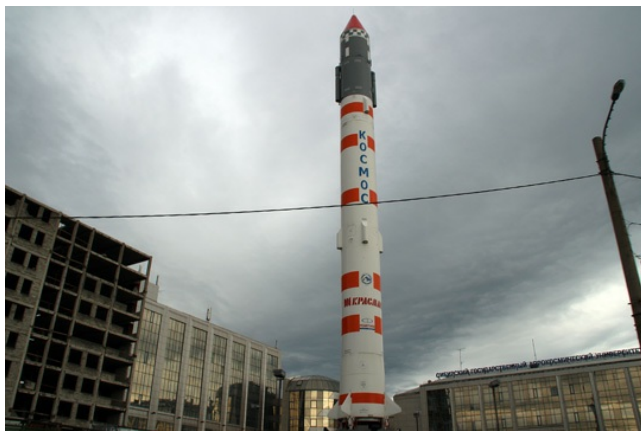
У аэрокосмического университета.