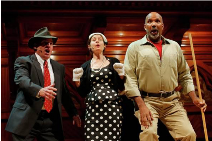
Опера "Прибор Блонского" на церемонии вручения Шнобелевской премии.

Церемония прерывалась представлением оперы "Прибор Блонского", лекциями нобелевских лауреатов и маститых ученых (которые должны были уложиться в 1 минуту).