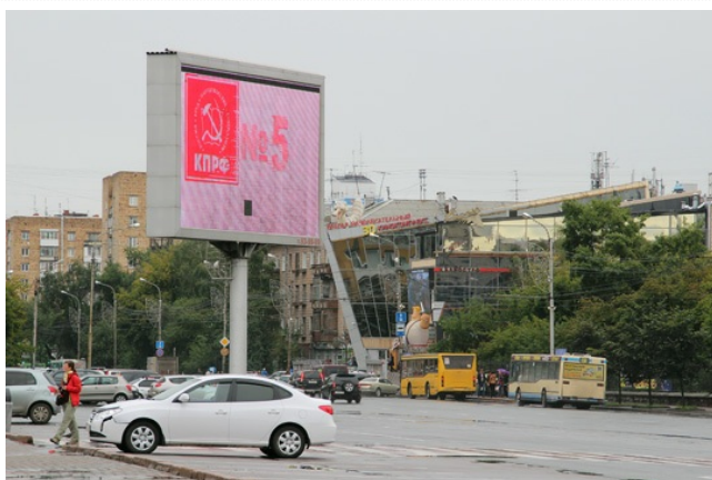
КПРФ рекламируется близ главного в городе памятника Ленину – аккурат напротив краевой администрации.