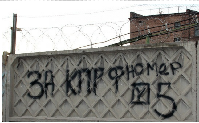
А также – где придётся и как получится.