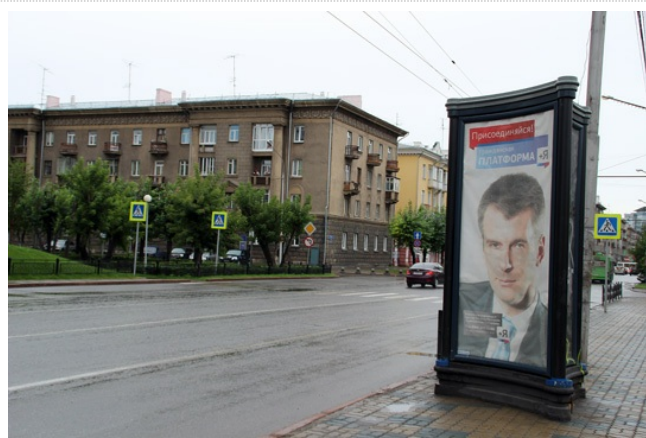
Михаил Прохоров разместился через дорогу от здания Законодательного собрания края. Оно в Красноярске дислоцируется отдельно от региональной исполнительной власти.