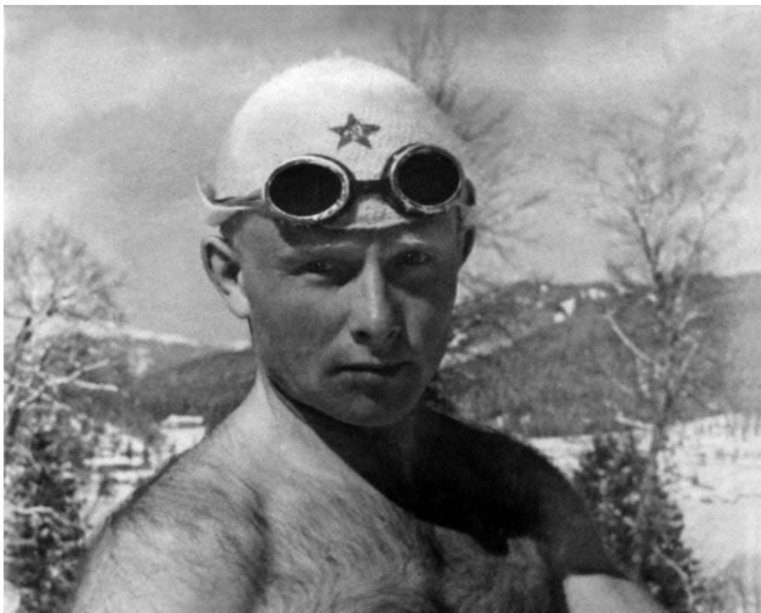
Евгений Абалаков на тренировке в 1934 году.