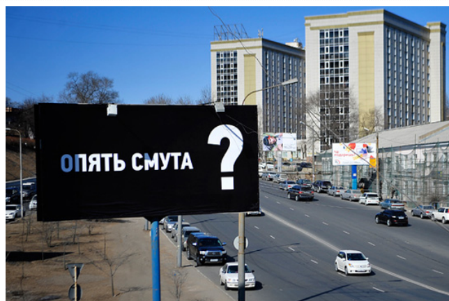
Агитационный плакат к выборам президента РФ 4 марта 2012 года на одной из улиц Владивостока

Самые яркие российские предвыборные кампании прошлого.